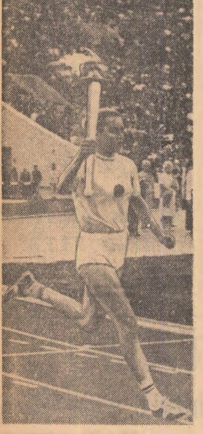
Natalia Kucinskaja — Burda, campioană olimpică la gimnastică purtând forța pe stadion

De asemenea, oaspeții români au fost invitați la forurile sportive din R.S.S. Armeană. La Erevan am sosit împreună cu președintele C.I.O. Avery Brundage, și alți delegați de peste hotare. Am avut plăcuta surpriză să fim oaspeții fostului campion mondial de pentatlon modern Igor Novikov, vicepreședinte al Comitetului R.S.S. Armeană de cultură fizică și sport, care ne-a făcut tuturor o caldă primire. Cu acest prilej am cunoscut multiple realizări ale acestei republici, am vizitat centrul sportiv olimpic, am admirat frumusețile capitalei Armeniei sovietice și împrejurimile ei.