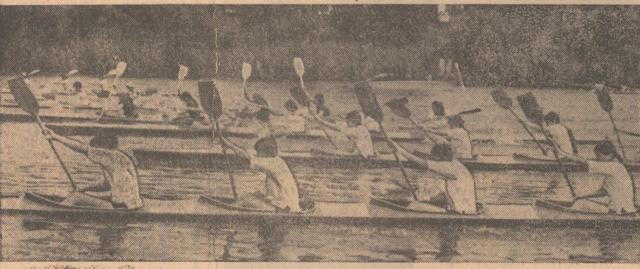
Start în cursa de K4 — junioare II — una din cele 24 finale ale campionatului republican de caiac-canoe rezervați juniorilor și tineretului.

Ieri, pe Snagov, s-au disputat cele 24 de finale ale campionatului republican de caiac-canoe rezervat juniorilor mici, mari și tineretului.