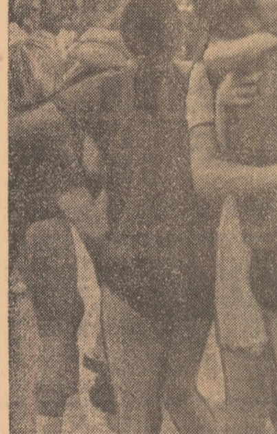
Entuziasm, bucurie, îmbrășișări după frumoasa victorie realizată de baschetbalistele noastre asupra reprezentativei Greciei.