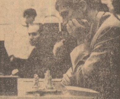
Petrosian (stînga) și Fischer în timpul întâlnirii lor de la meciul U.R.S.S. — Echipa lumii (Belgrad, martie — aprilie, 1970). În planul secund, Mihail Tal.

Și acum, întâlnirea dintre Fischer și Petrosian! Prin prisma rezultatelor