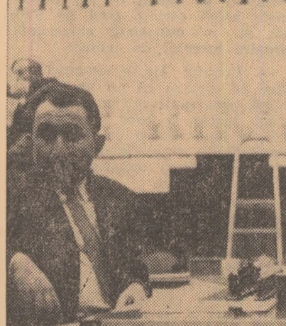
Petrosian (stînga) și Fischer în timpul întâlnirii lor de la meciul U.R.S.S. — Echipa lumii (Belgrad, martie — aprilie, 1970). În planul secund, Mihail Tal.

Și acum, întâlnirea dintre Fischer și Petrosian! Prin prisma rezultatelor