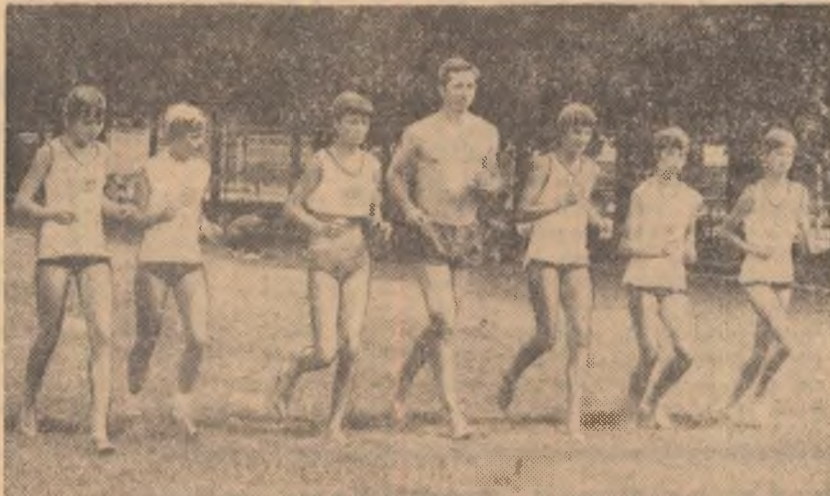
Atletele din echipa Cehoslovaciei, eleva la Școala generală S.D.S. din Trinec, aspirante la locul 1, în timpul ultimului antrenament...