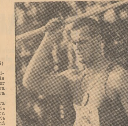
IAN LUSIS, pentru a patra oară campion european la aruncarea suliței

Prima medalie de aur repetată de un sportiv al țării celor 1.000 de lacuri a stîrnit un entuziasm de nedescris. Finlandezii, recunoscuți prin temperamental lor calm, au devenit pe loc niște suporteri cu firiul vulcanic de tipul celor brazilieni, care au salutat cu un an în urmă câștigarea pentru a 3-a oară a „Cupei Jules Rimet”. Televiziunea și-a modificat aproape total programul din timpul seri, redind încă de trei ori desfășurarea întregii cursă, chiar în program de miercuri dimineața. Väätainen a mai putut fi urmărit pe micul ecran în spectaculoasa sa izbîndă.