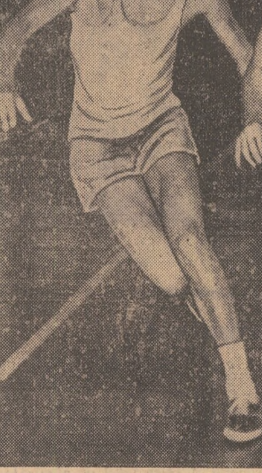
Imagine de la antrenamentul juniorilor români, desfășurat ieri la Sala Floreasca