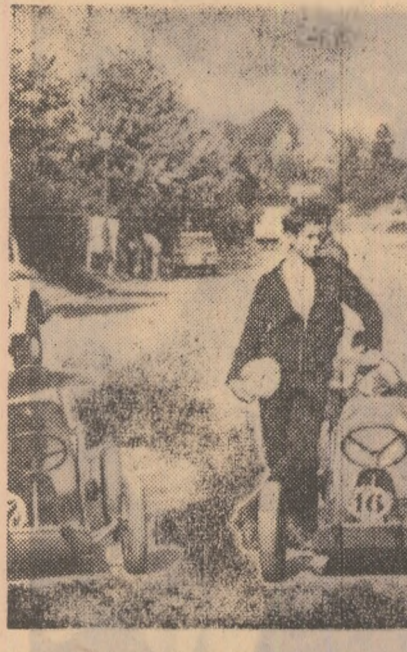
Echipele de carturi înainte de start