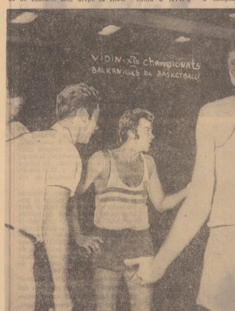
Nemulțumiri și reproșuri, scene neplăcute, pe cit de frevente, în momentele de pauză ale echipei române.