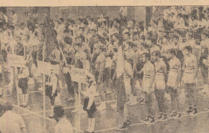
„Cupa Prietenia” la baschet-juniori