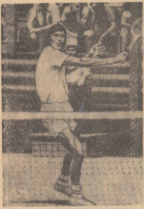
Ilie Năstase și Ion Țiriac, în ambianță braziliană, evoluînd pe arena „Pinheiros” din Sao Paulo.

Tenismenii noștri de excepție, maeștrii emeriți Ion Țiriac și Ilie Năstase, au întors o nouă filă de istorie