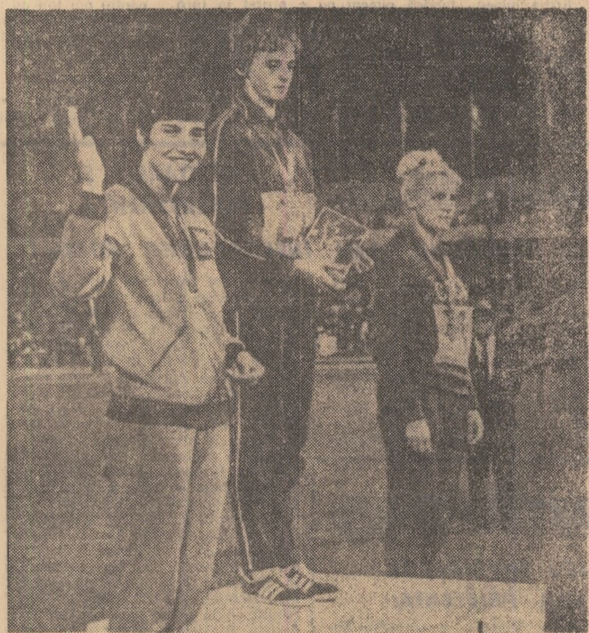
Un moment de neuitat: Viorica Viscopeanu, campioană olimpică la săritura în lungime la J.O. din Mexic.

PENTRU A DOUA OARĂ, ÎN ISTORIA „CUPEI DAVIS”