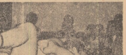
Imponderabile?... Acești doi luptători par într-adevăr să plutească deasupra saltelei, într-un moment al disputei lor acerbe. Este un reușit instantaneu fotografic, datorat reporterului vest-german W. Bias, care se poate mîndri, în mod justificat, cu realizarea sa.

Joi, 28 august, etapa a doua Brașov - Rușar - Brașov 124 km.