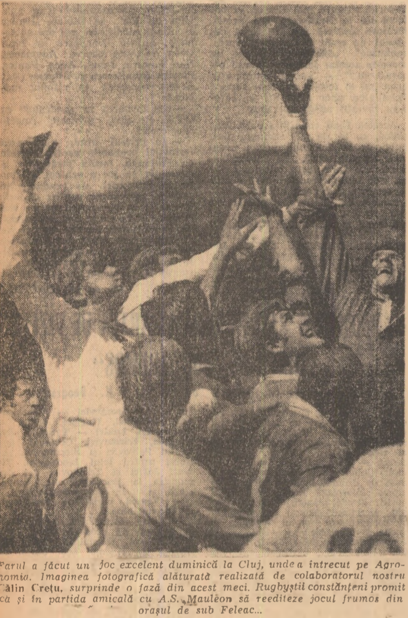
Farul a făcut un joc excelent duminică la Cluj, unde a întrecut pe Agro-noma. Imaginea fotografică alăturată realizată de colaboratorul nostru Gălin Crețu, surprinde o fază din acest meci. Rugbyștii constănțeni promit că și în partida amicală cu A.S. Mauléon să reediteze jocul frumos din orașul de sub Feleac...

puncte, nesancționarea mingii scâlpate din mână și celelalte. Numai că jucătorii nu s-au obișnuit încă cu ele” (Dan Lucașcu, arbitru).