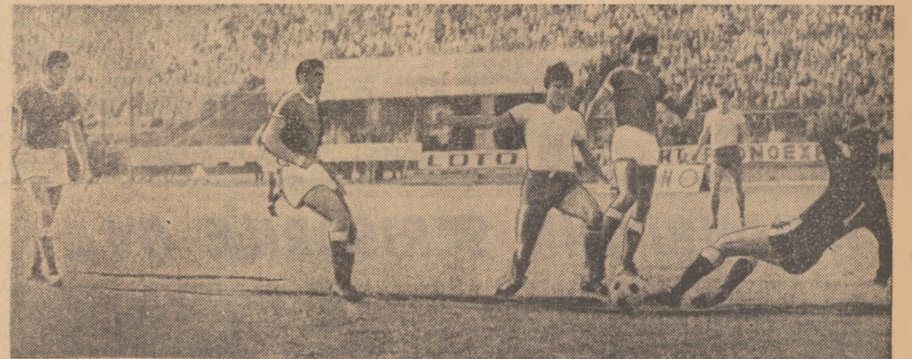
Pe marginea meciului-test al echipei reprezentative de fotbal cu O.F.K. Beograd