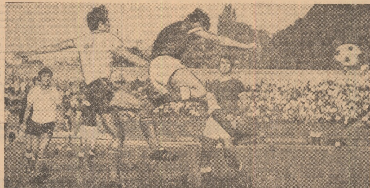
Ivan II, puțin jucat în această partidă, nu poate cîștiga duelul aerian cu masiva apărare belgrădeană.