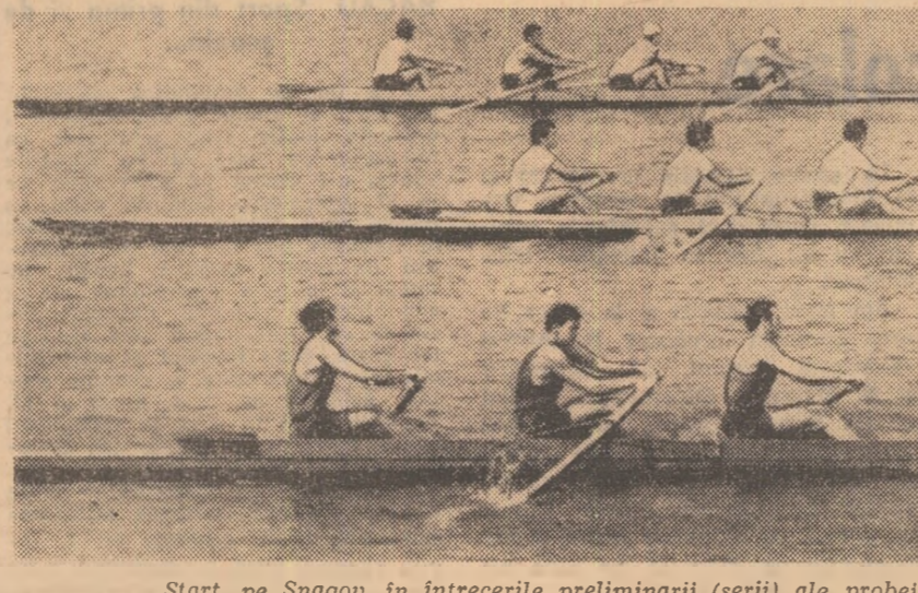
Start, pe Snagov, în întrecerile preliminare (serii) ale probei de schif 4 f.c.