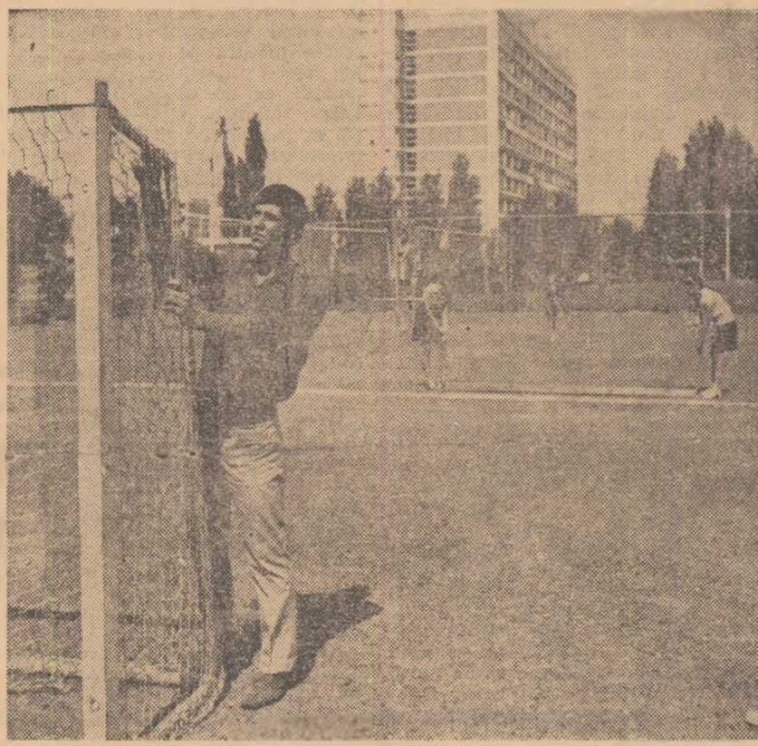
Instantaneu la ordinea zilei: la baza sportivă a grupului școlar al I.M.U. profesorii și elevii fac ultimele pregătiri în vederea deschiderii noului an de învățămînt.