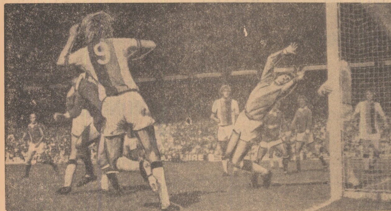
Jackson, portarul lui Crystal Palace, este învins pentru a treia oară de tirul atacanților de la Manchester United, una din performerile etapei de simbrătă a campionatului englez

Austria Salzburg a jucat simbrătă la Linz, cu LASK, unde a terminat