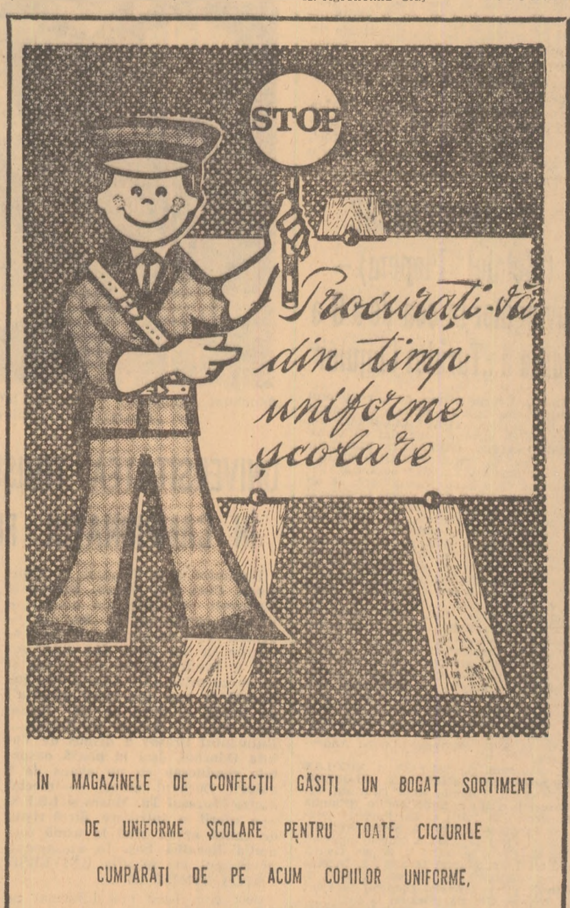
IN MAGAZINELE DE CONFEȚII GAȘTI UN BOGAT SORTIMENT DE UNIFORME ȘCOLARE PENTRU TOATE CICLURILE CUMPARATI DE PE ACUM COPIILOR UNIFORME, PENTRU A EVITA AGLOMERATI

Rezultatele etapelor Gloria - Rulmentul Birlad 14-10 (10-0); Agronomia Cluj - Universitatea Timisoara 0-10 (0-3); Dinamo - Steaua 6-6 (3-0); Grivita Rosie - Farul Constanta 42-6 (21-3); Politehnica Iasi - C.S.M. Sibiu 16-6 (7-3); Sportul studentesc - Știința Petroșani 7-8 (0-4). ETAPA VIITOARE (19. IX). Știința Petroșani - C.S.M. Sibiu; Farul Constanta - Politehnica Iasi; Steaua - Grivita Rosie; Universitatea Timisoara - Dinamo; Rulmentul Birlad - Agronomia Cluj; Sp. studentesc Buc. - Gloria Buc.