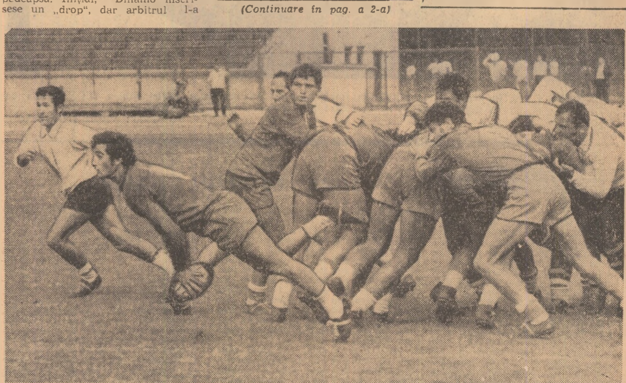
O frumoasă acțiune a lui Tața (Stea), după o grămadă ordonată, dar mijlocașul echipei campioane n-a mai făcut jocul său spectaculos (și mai ales eficace) cu care și-a cistigat locul în echipă...

Stea, de partea cealaltă, nu s-a ridicat în toate momentele jocului la nivelul adversarului. A început partida mai calm, dar a făcut față cu dificultate atacurilor supra-numerice ale dinamoviștilor. Echipa militară n-a mai avut prospețimea-i cunoscută, înaintarea a acționat cu mai puțină mobilitate. Dar cel mai descoperit sector al echipei Steaua l-a constituit linia de mijlociși, în care Tața, mai ales, a fost complet depășit de joc.