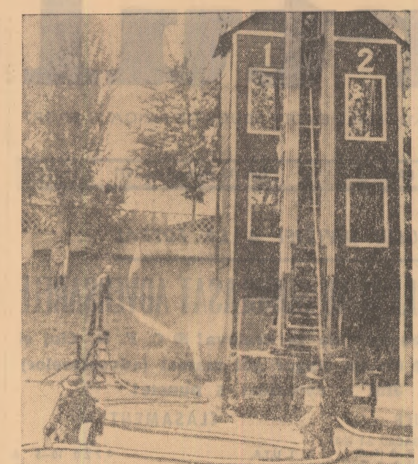
Aspect de la reușitele și mult aplaudate demonstrații efectuate ieri de către formațiile de pompieri la baza de antrenament din cartierul bucarestean Tei