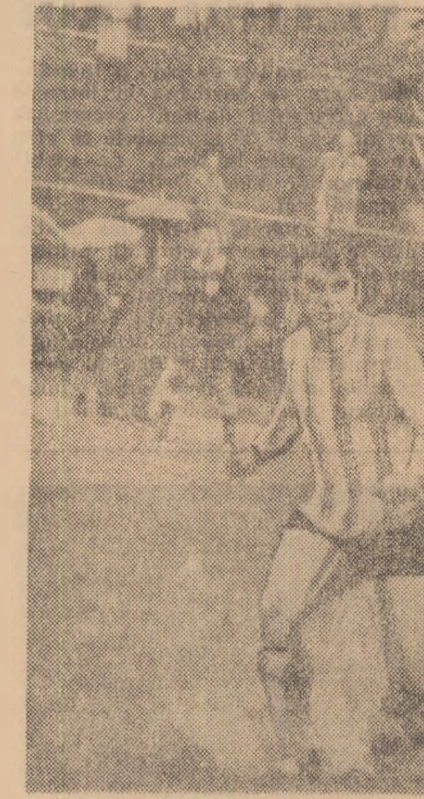
Dispută aprigă cu adversarul și... ploaia în careul metalurgistilor din Plopiești. Fază din meciul Polana Cimpina - Metalul Plopiești: 0-1

Deocamdată, în seria I, în fruntea plutonului întâlnim formația care bate mereu la porțile diviziei A, fără să se răsufoare niciodată: „intra”. Este vorba de Sportul studentesc (ex Politehnică, ex Știința).