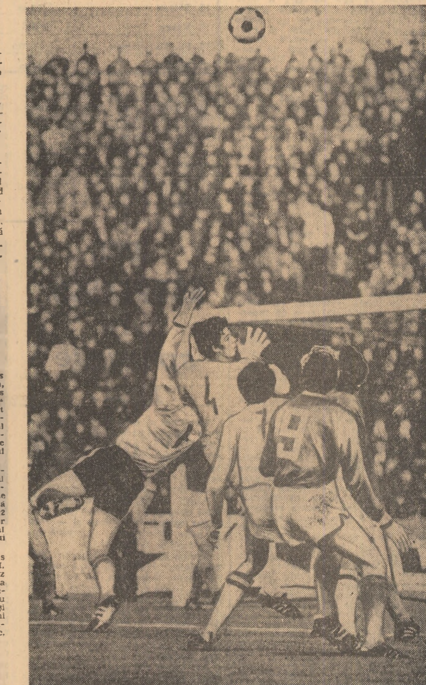
O imagine din primul meci al preliminariilor C.E. dintre echipele Ungariei și Franței desfășurat la Budapesta (1-1). Un atac al echipei franceze la poarta fotbalistilor maghiari.

Competiția ciclistă internațională dotată cu „Cupa Agostoni” s-a încheiat cu victoria ruterului italian Franco Bitossi, cronometrat pe distanța de 223 km în 5 h 46 (medie orară 40,405 km). El l-a înțrecut pe sprinterul final pe belgianul De Groot și pe francezul Roger Pingeon. Grupul plutonului a sosit la 2:29 de în-