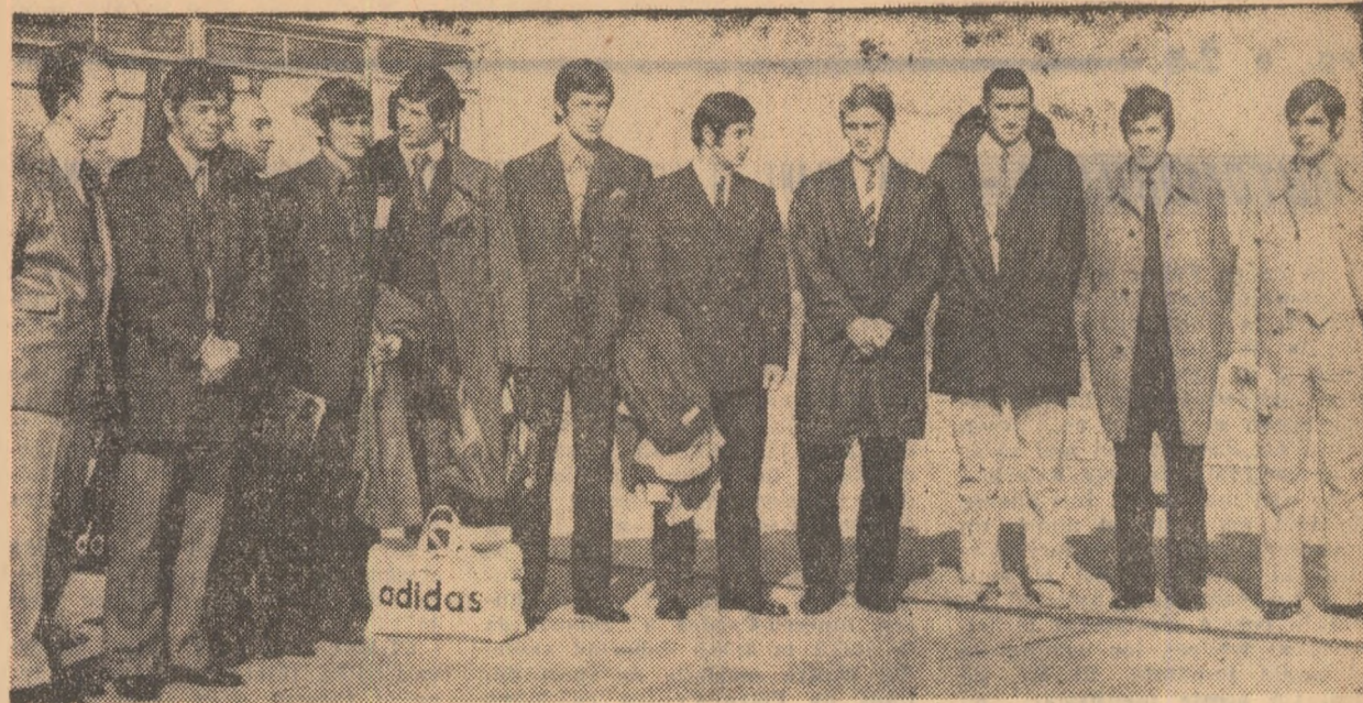
Otopeni ora 10. „Olimpicii” înaintea startului aerian spre Copenhaga