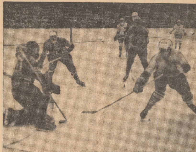
În faza aceasta, hocheiștii echipei Avintul Miercurea Ciuc vor rata înscrierea unui gol. În finalul partidei cu Dunărea Galați ei au cîștigat cu scorul de 9-1.