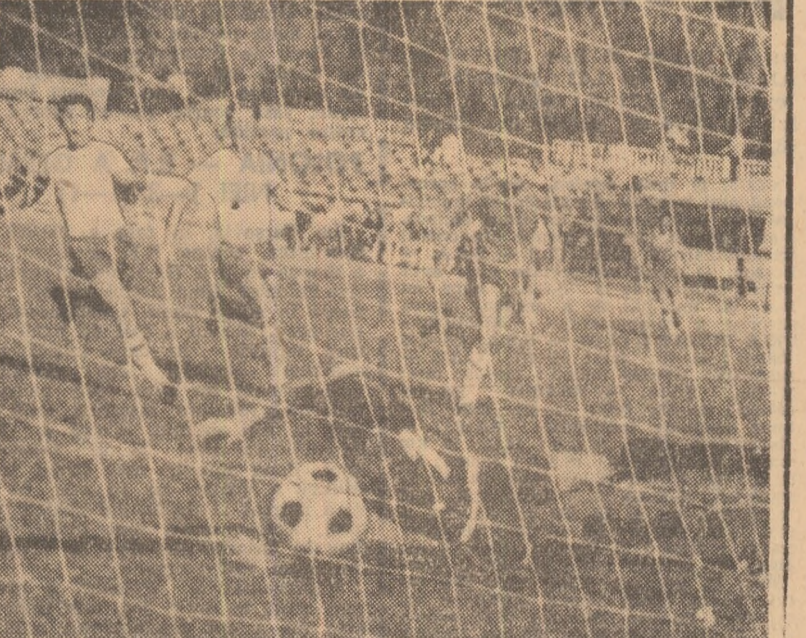
Stochiță (Dinamo) deschide scorul. Fază din partida Dinamo — Ș. N. Olenița (din campionatul de juniori) — câștigată de bucureșteni cu scorul de 4-1.