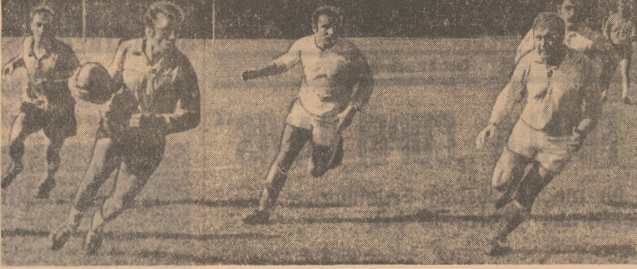
Rugbiștii de la Dinamo au obținut ieri, pe terenul Parcul copilului, o nouă victorie. Iată-i lansând un nou atac spre buturile echipei Gloria.

Universitatea continuă să conducă în clasament • Agronomia Cluj la prima victorie