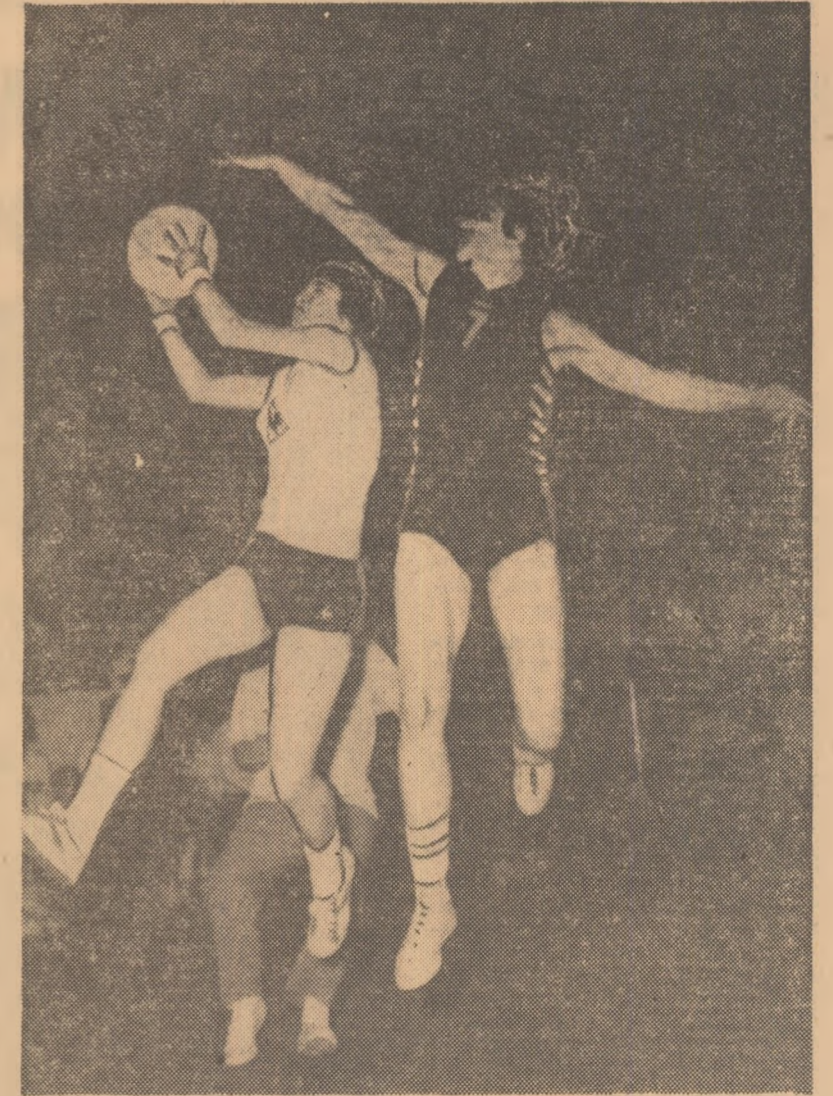
Imagine din ultima finală a C.C.E. în care s-au întrecut echipele feminine Daugava Riga și Clermont-Ferrand