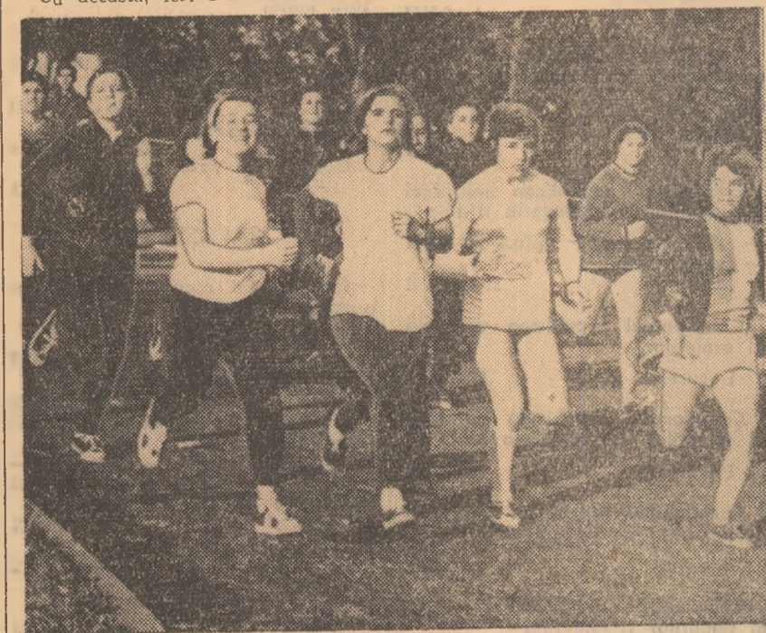
Participantele la finală pleacă vertiginos în cursa care va desemna prima cîștigătoare a „Cupei Diana” la cros.

mbucurător, fapt remarcabil și de cel cu care am stat de vorbă înainte și după consumarea cursei. Proba de cros din cadrul „Cupei Diana” a găsit un larg ecou printre salariații întreprinderilor din sectorul nostru — ne-a spus președin-