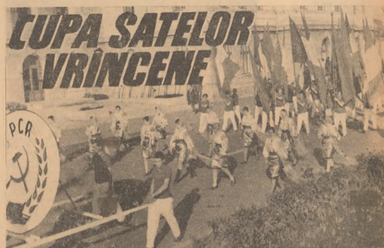
Coloana sportivilor defilează pe străzile orașului Focșani