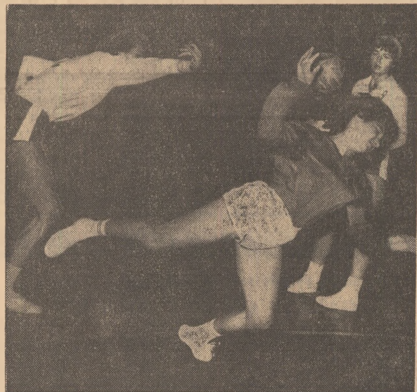
Pătrundere pe semicerc și din nou gol pentru junioarele noastre

Ieri, la Zîtrich, s-au tras la sorți meciurile din optimele de finală ale Cupei U.E.F.A. În această etapă, echipele românești vor întâlni adversare redutabile. U.T.A. VA ÎNTILNI FORMAȚIA PORTUGHEZĂ VITORIA SETUBAL (la 24 noiembrie la Arad și la 8 decembrie la Setubal), IAR RAPID VA SUSTINE PRIMUL MECI CU ECHIPA ENGLEZĂ TOTTENHAM HOTSPUR, ÎN DEPLĂȘARE (la o dată care se va stabili ulterior — la cererea clubului bucureștean) și la 8 decembrie, la București. Într-o și celelalte partide (primule echipe sînt gazde în tur): A.C. Milan — Dundee United; F.C. St. Johnstone — Zeleznicear Sarajevo; Rapid Viena — Juventus Torino (sau F.C. Aberdeen); P.S.V. Eindhoven — Lierse S.K.; F.C. Carl Zeiss Jena — Wolverhampton Wanderers. Meciurile din tur sînt programate la 24 noiembrie, iar cele din retur, la 8 decembrie. Reamintim că tragerea la sorți în sfîrșitul de finală ale C.C.E. și Cupa cupelor va avea loc la 12 ianuarie 1972.