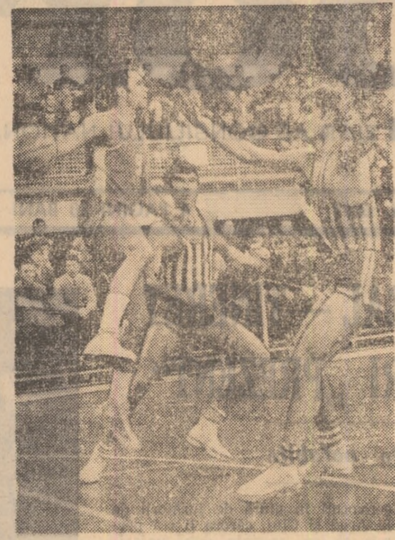
La încheierea campionatelor naționale, premii coșterilor, echipelor cu cele mai bune procentaje în aruncările libere și celor mai disciplinate formații.

Steaua-Rapid, o altă întâlnire interesantă. programată azi în sala Floreasca