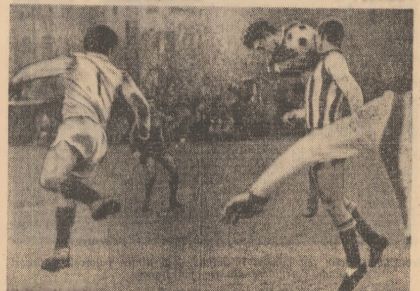
Alertă în careul fotbalistilor din Rm. Vilcea, în poarta cărora mingea a...