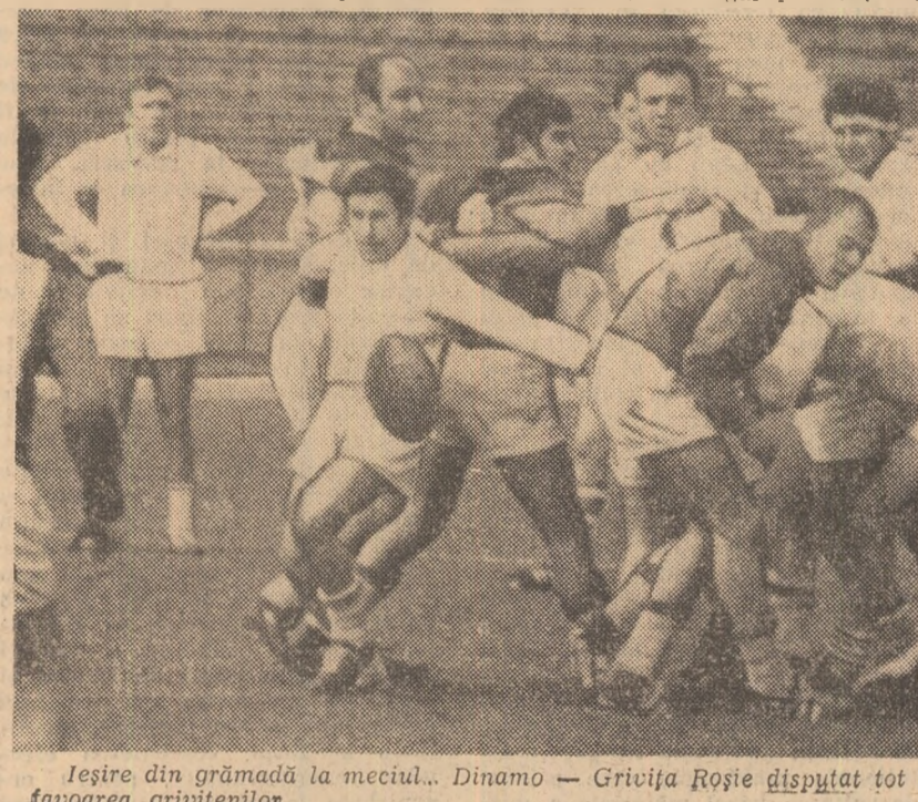
Ieșire din grămadă la meciul... Dinamo — Grivița Roșie disputat tot în favoarea grivițenilor

plăc Siete! Mecul interesează ambele echipe: gazdele, pentru a reveni în prima jumătate a clasamentului, oaspeții în ideea feteții de a reîntra în discuție pentru primul loc. Sub semnul echilibrului se anunță partidele Sportul studentesc — Farul, Gloria — C.S.M. Sibiu și Agronomia Cluj — Politehnica Iași, în care gazdele, deși păstrează, teoretic, prima șansă, întîlnesc adversare puțin dispuse să se mulțumească numai cu un singur punct. (1. st.)