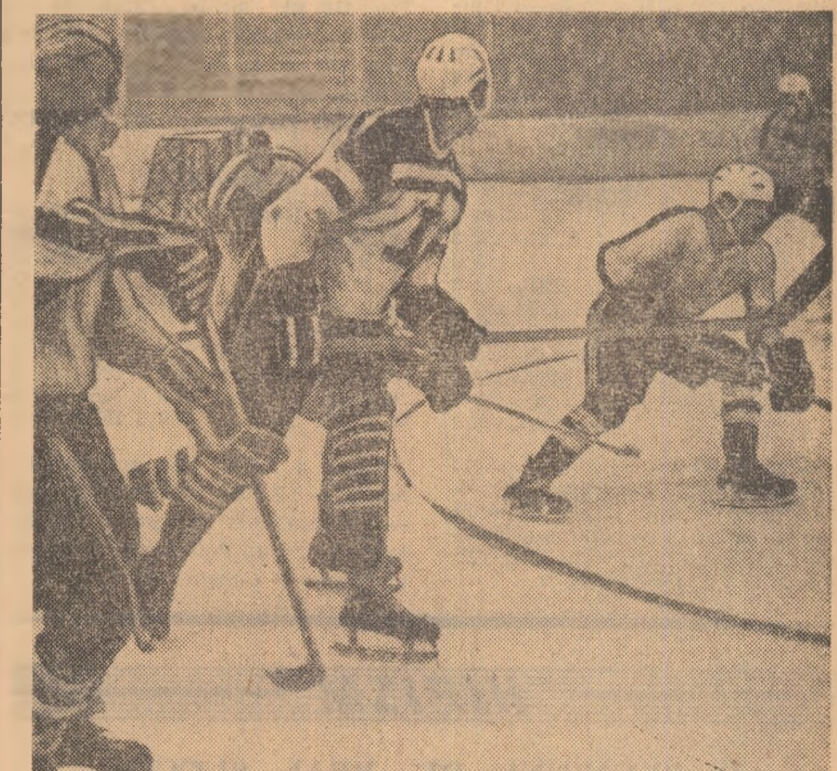
Și actualul campion începe sub semnul marii rivalități dintre fruntașele crosei românești, Dinamo și Steaua. În fotografie: un moment de înclăștare tipic întâlnirilor dintre aceste două echipe.

Primele echipe ale țării încep astăzi turneul lor maraton