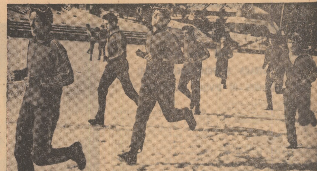
O ușoară încălzire pe terenul din Poiana

Dar nu numai tehnicienii de la „Elektroimpex” lucrează de zor în Sala Sporturilor. În acest dute-vino, aflăm că aici s-a amenajat un spațiu special pentru biroul de presă, unde va funcționa o centrală telefonică cu linii interne și internaționale suficiente — se speră — pentru a satisface cerințele numeroșilor comentatori prezenți la Galați, dintre care nu mai puțin de 21 de peste hotare. Este și acesta un semn de nețăgăduț al lucrului ceva pe care-l are „Trofeul Carpați”. De asemenea, s-au pregătit cu atenție vestiarele și, n-și s-a precizat — în glumă, desigur