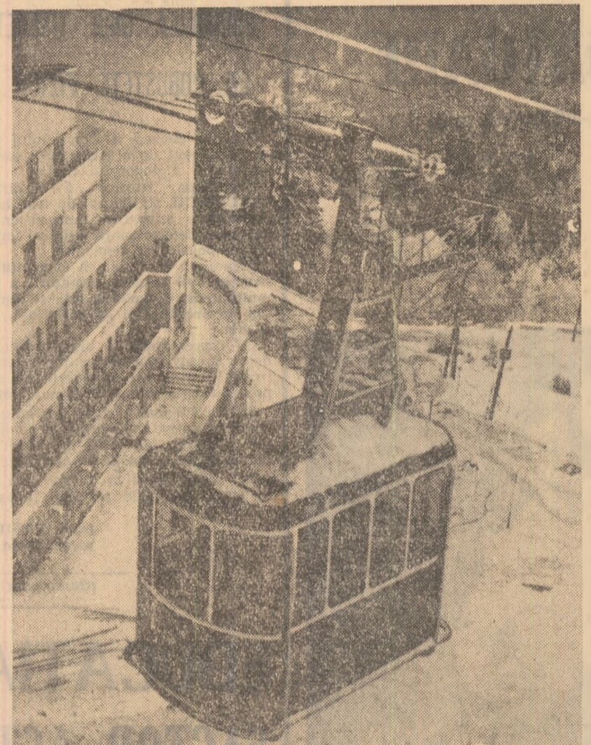
Noile telecabine sînt din iarna aceasta pentru schiori și amatori de înot...