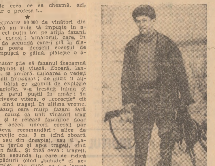
Trei fazani doborîți cu doar trei focuri constituie o performanță!

Mîine începe sezonul de vîntoare la fazani. Ziua aceasta, de „deschidere la fazani”, îmi amintesc, an de an, însoțindu-mă la vîntoare, cînd badea Nistor îmi arunca de după o tuță (pe care eu n-aveam voie s-o gîlu) o cutie de conserve (goale) și cu trabaș s-o fracturase de secundă care-l stă la dispoziție, nu poate deosebi cocoșul de găină și împușcă o găină, piștește o amendă! Orice vîntor știe că fazanii înseamnă culoare, zgomot și viteză. Zboară, lansat, cu cea. 65 km/oră. Culoarea o vedeți după ce l-ați împușcat: de auzit îl auziți cînd a bătut cu zgomot de explozie aerul cu arpie, v-a tresărit înimă și alt zgomot patul pus în umăr: în ceea ce privește viteza, o „corcete” e mai mare, cînd trageți. În ultima vreme, au fost văzuți cam mulți fazani fără coadă, din cauză că unii vîntori trag cam trînz și le retează fazanii doar coada! De aceea, uneori, cocoșii par găini! Cîteva recomandări: alice de 3 mm, corcetea cea. 3 m (cînd zboară din stînga sau din dreapta), sau 11 „copeniți” cu țevile și apoi trageți, cînd văd vînt din față... și încă ceva: trageți, la fazan, în școada în care se ridică deasupra pădurii (cînd „bubule” e aerul cu arpie), sau după ce s-a lansat în zbor. Dar, dacă nu ați participat la mearc două sau trei sechete de tir în poligonul de talere, nu vă sfătuiți să mergeți la o vîntoare de fazani. Să pătat și de carușe și de fazanii întîmpinător rânji. Este și aceasta o problemă de etică! ELIE CĂRCIU