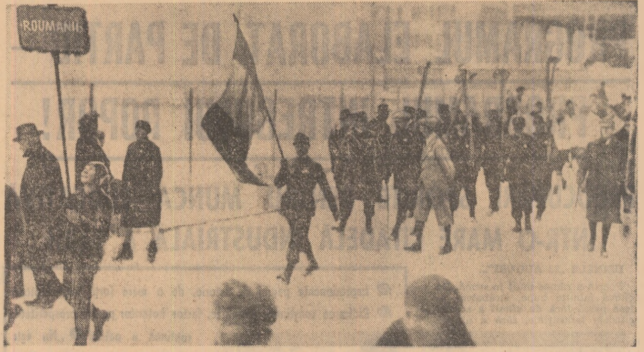
Delegația României desfășurând cu prietenii festivitățile de deschidere la St. Moritz