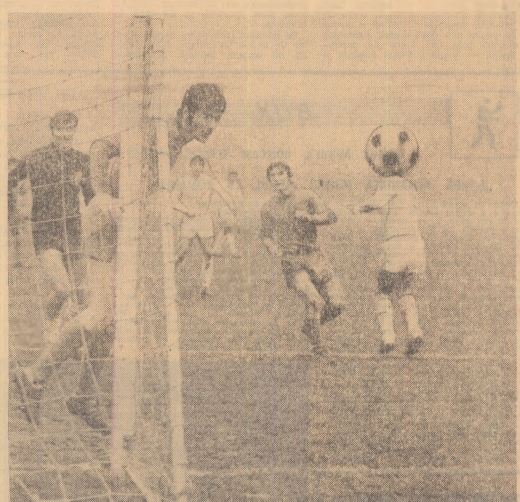
Trucaj fotografic? Nu, Sălcănu, al cărui cap este mascat de minge, a șutat spre poartă, balonul fiind respins în corner de către Sătmăreanu.