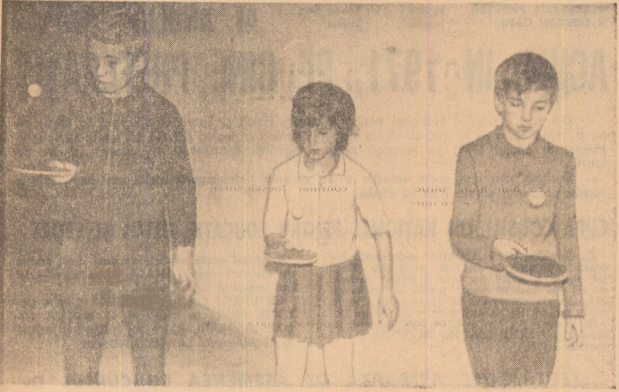
La primii pași în pătrunderea tainelor sportului cu mingea de celuloid