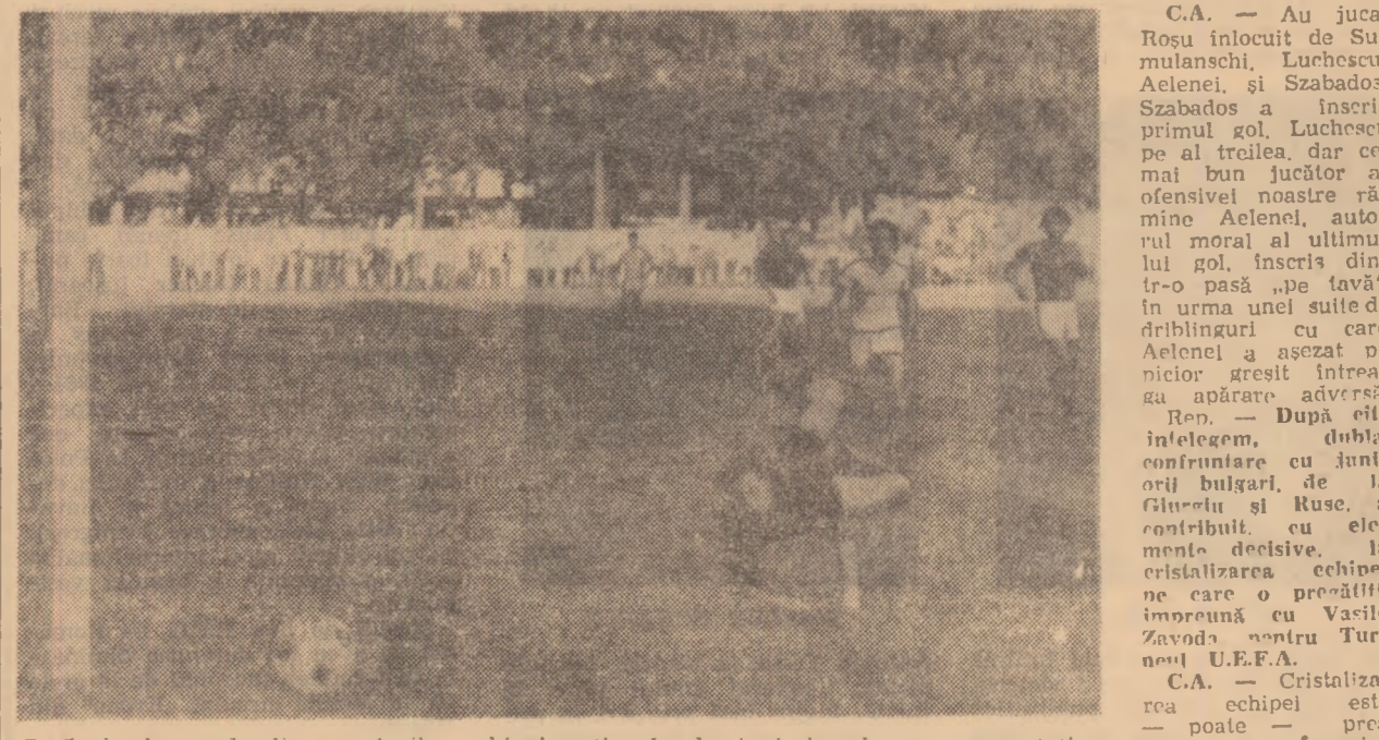
Facă de la unul din meciurile echipei naționale de juniori, cel cu reprezentativa Cehoslovaciei (scor 0-0), disputat în toamnă la Zărnești