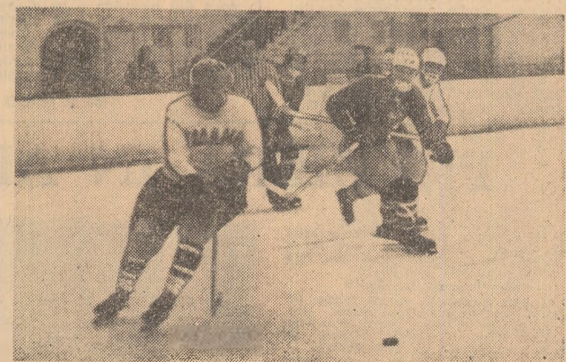
Înaintașii români încearcă prin acțiuni individuale să găsească drumul spre poartă. Va fi greu...