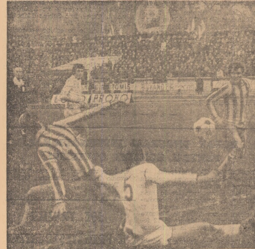
Fază de la unul dintre cele mai disputate meciuri ale turului campionatului, Dinamo (1-1) Petrolul (1-1)