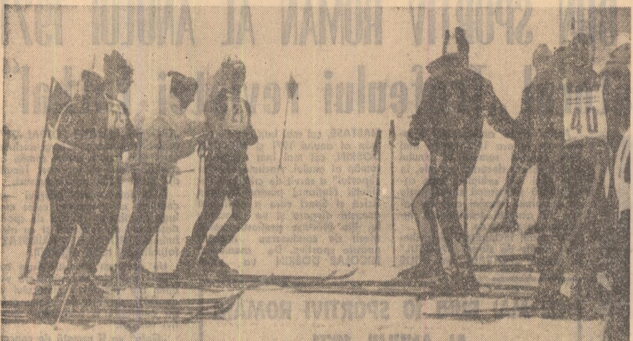
Mai sînt cîteva momente pînă la start. Va fi prima plecare oficială a actualului sezon, și fiecare concurent își dorește o comportare cît mai bună...