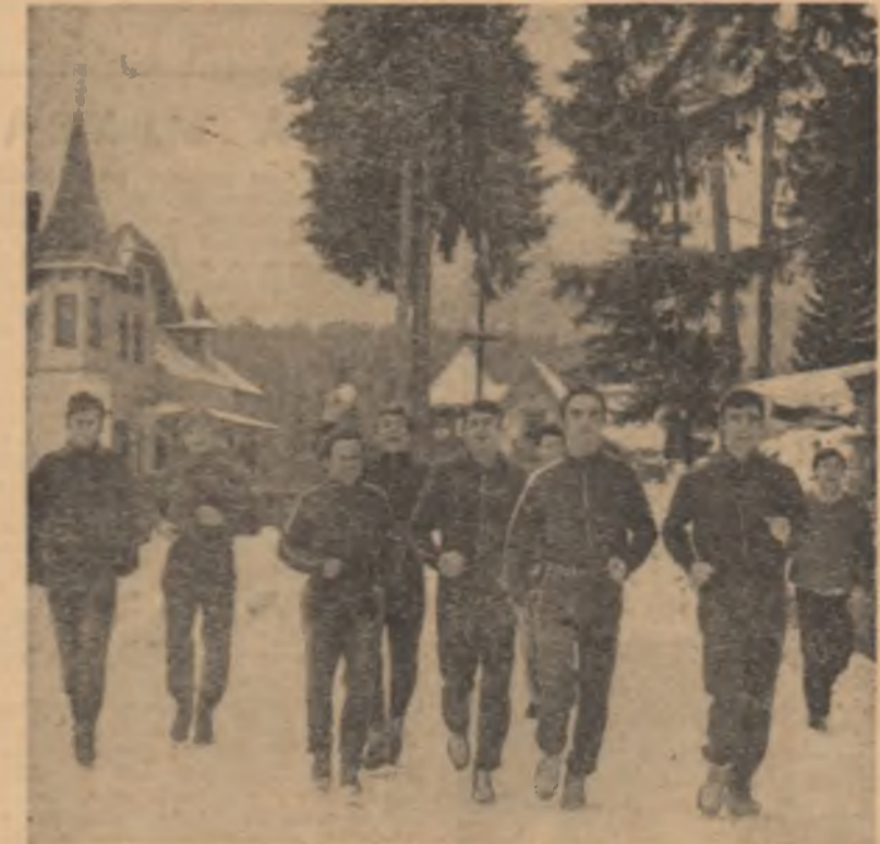
Antrenament în aer liber, în parcul încălzit din Predeal

fiind bunele rezultate obținute în alți ani, fetele și băieții au hotărît, de comun acord, să-și petreacă o parte