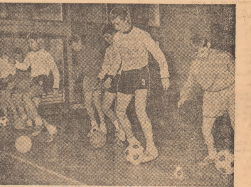
Secvență de la antrenamentul fotbalistilor-scolari.