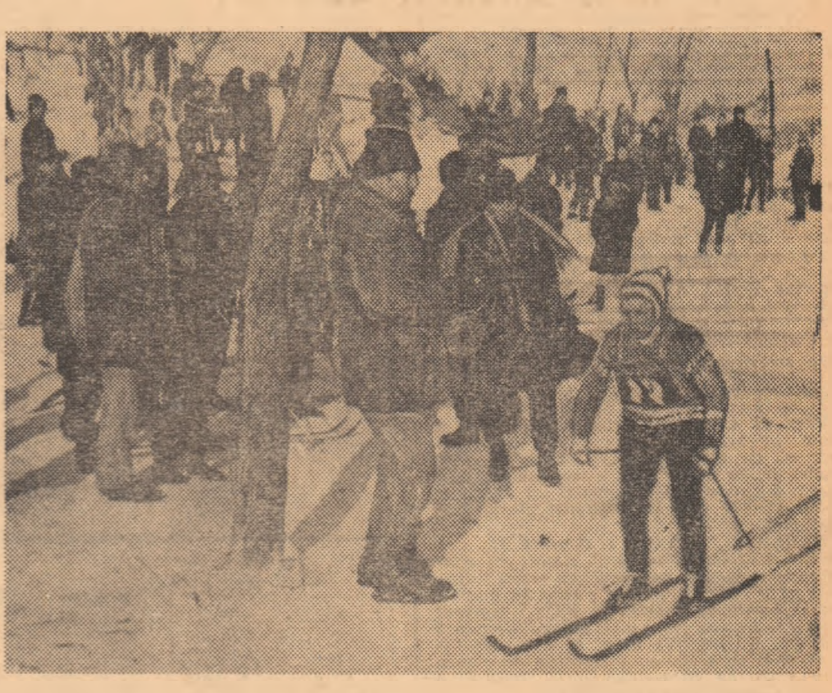
Start! Un nou concurent, reprezentant al comunei Șirnea, a plecat în cursă. Il vom revedea, oare, peste cîteva ani, la marile concursuri?

La 1300 de metri altitudine, acolo unde se întîlnesc Piatra Craiului, Bucușii și Făgărașul, se află comuna Șirnea. Adăpostită la dreapta șoselei Brașov—Cîmpulung, această așezare ale cărei case de piatră și lemn stau parcă aninate pe versanții din jur, constituie, vara, un veritabil cap de pod pentru drumeții, iar în anotimpul gerurilor și zăpezii, oferă pe pantele sale excelente posibilități pentru practicarea schiului. Cu ocazia vizitei pe care am făcut-o... cu elocva-zile în urmă, locuitorii acestei pitorești localități, ca și cei din satele învecinate, erau în febra pregătirii tradiționalei lor sărbători, „Iarna la Șirnea”. Iar pe prim plan, se află concursul de schi fond, rezervat copiilor.