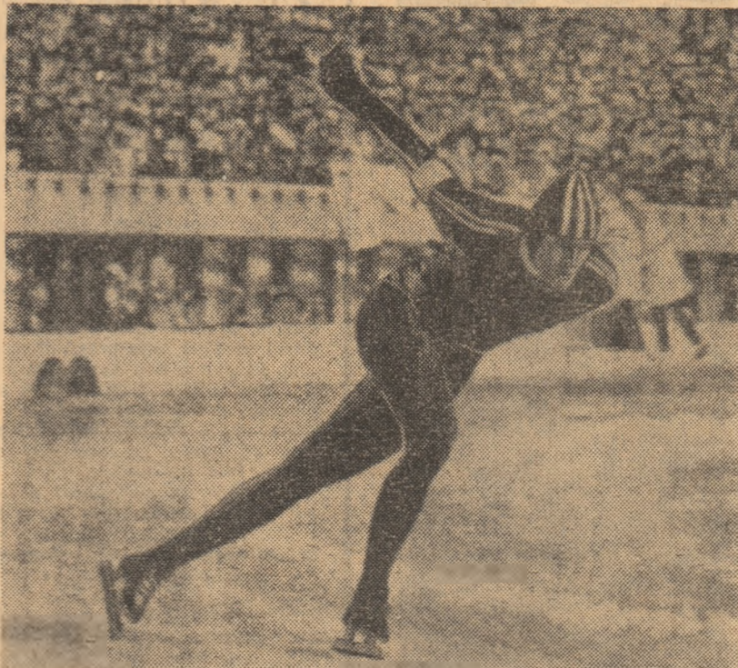
Victorie dublă pentru Ard Schenk: și titlul și recordul olimpic pe 1500 m

Acum când se apropie de 30 de ani, mare specialista a cursei de 5 km dovedește un plus de rezistență și medalia de aur obținută în cursa de 10 km este o promisiune a învinsătoarei din Ijevsk pentru o colecție tot atât de strălucitoare ca și cele realizate de compatrioatele sale Kolcova și Boiarskih la C.M. din 1962 și J.O. din 1964: 3 medalii de aur.