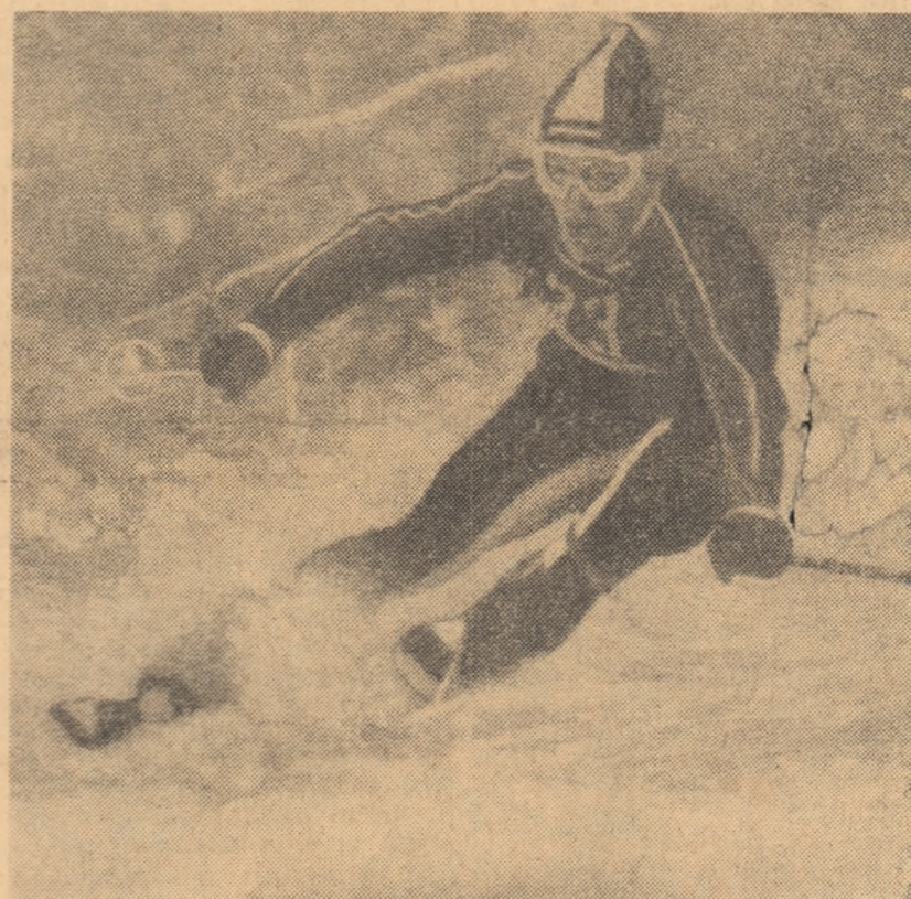
Gh. Vulpe, dublu învingător în „Cupa Universitatea Brașov”