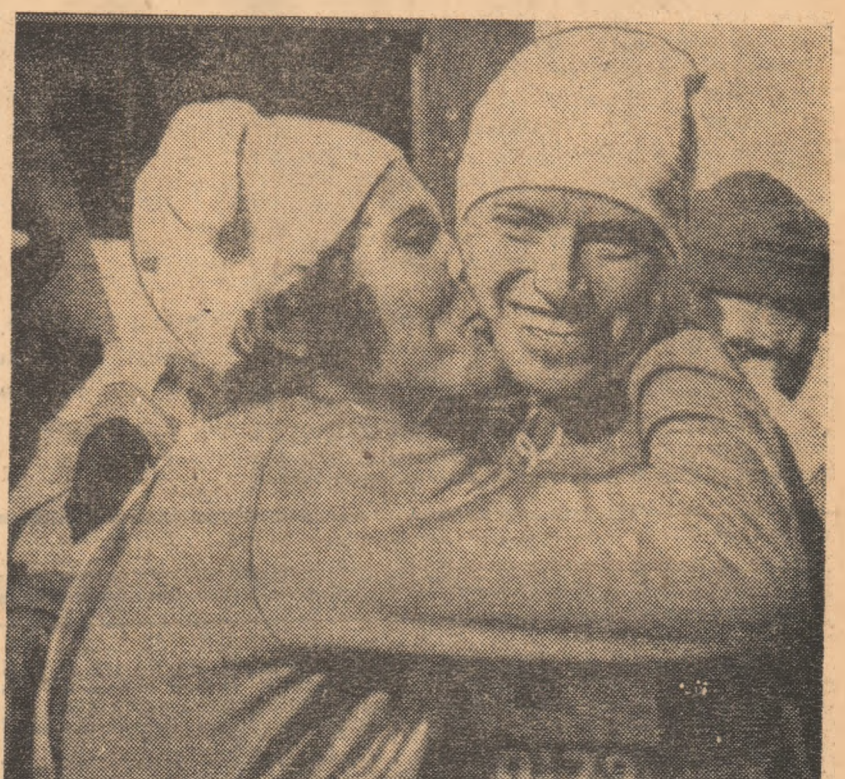
Secundanta Aleutina Olunina (stînga) o îmbrățișează pe noua campioană olimpică de schi-fond, compatrioata ei Galina Kulakova