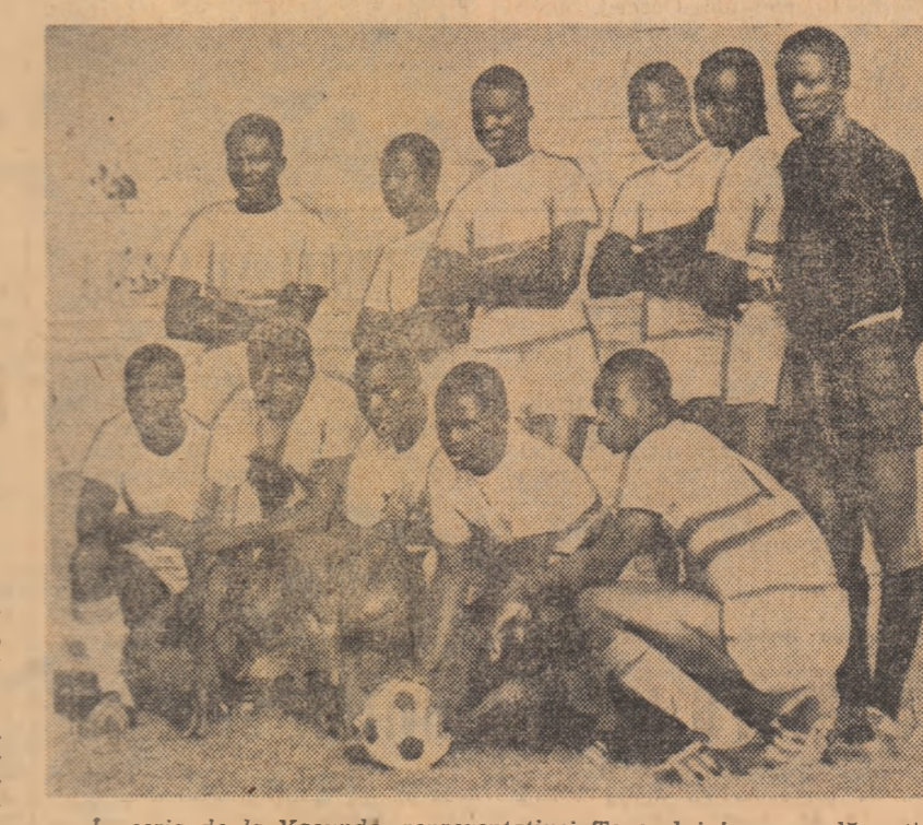
În seria de la Yaoundé, reprezentativei Togo-ului i se acordă puține șanse... Cine știe, însă, de unde sare iepurele?!