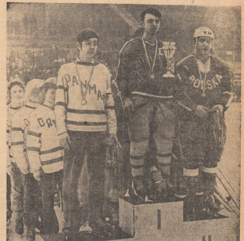
București 1970: reprezentativa de hochei (juniori) a României pe prima treaptă a podiumului campionatului european (grupa B)