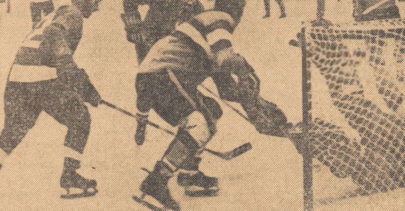
GALAȚI 1970, grupa C a campionatului mondial de hochei pe gheață. Echipa Italiei (în tricouri cu dungi) câștigă cu insistență poarta formației Olandei