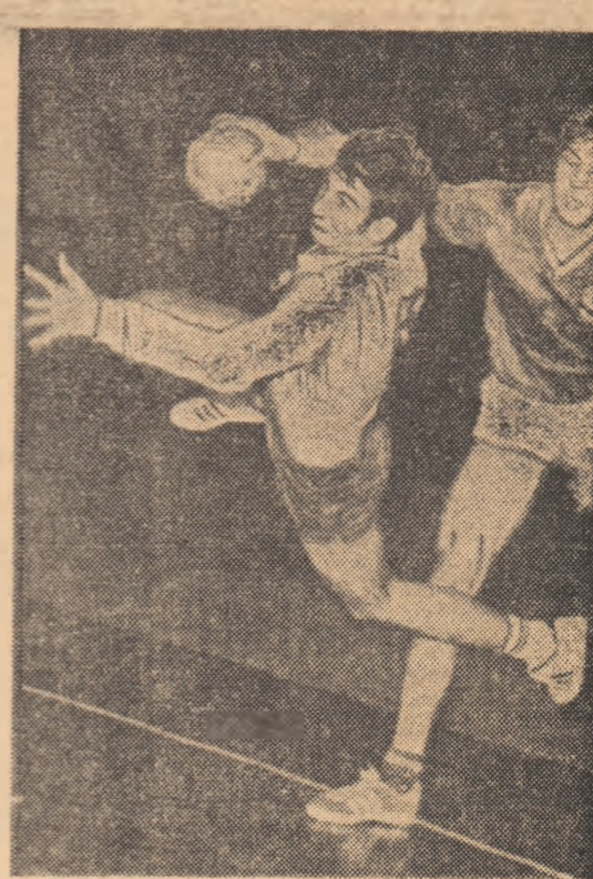
Bota, unul dintre tinerii jucători ai echipei noastre, purtător al speranțelor pentru J.O.

Din informațiile pe care le avem, la Ploiești organizatorii își încheie