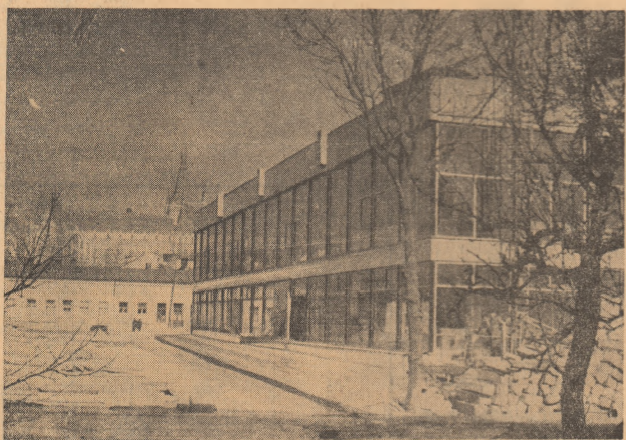
O nouă construcție sportivă în Iași: Palatul sporturilor

La Iași, sălile de sport satisfac cu greu cerințele mereu mai mari ale tineretului. În speranța că apetitul tineretului pentru activitatea sportivă nu este pasager, forurile în drept au și venit în întîmpinarea cerințelor, construind un adevărat palat al sporturilor, a cărui inaugurare va avea loc, poate și ca un simbol, în luna lui Mărțișor.