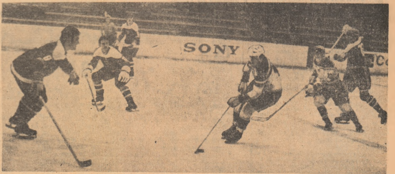
Un atac al hocheiștilor noștri la șoara reprezentativei austriece.