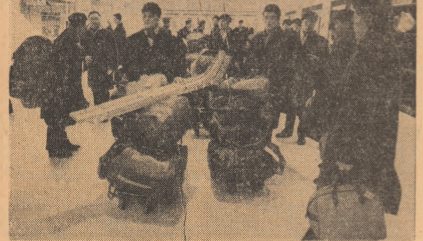
Hocheiștii chinezi, pe aeroportul din Stockholm, se pregătesc să se imbarce în avionul care îi va aduce la București

soluțiilor tactice în momentele dificile. Folosesc bine și lutele pe care le permit să folosească arma contractantă, adică de utilitate și de ofensivă la hocheiul modern. Mecurile lor din grupa C a C.M. sînt un foarte mare succes. Într-un sondaj al antrenorului Li Van-ci o părere asupra competiției care se deschide vineri, la Miercurea Ciuc. Cu o modestie caracteristică, dar specifică acestor oameni, el ne-a spus: „În jocurile de pregătire pe care le-am susținut cu hocheiștii din-neoastrostră, atât la Pekin, cit și în România, am avut foarte multe de învățat. Fructuos a fost și turneul în Suedia. Dar, jucătorii noștri mai au o cale lungă până la adevărată măiestrie. Va mai trebui să nuncim mult. Vom fi bucurosi să-i cunoaștem pe minunatii locuitori ai orașului Miercurea Ciuc, despre care am auzit că sînt mari cunoscători și pasionați ai hocheiului. Ne exprimăm speranța că întrecerea din grupa C a campionatului mondial se va desfășura într-un spirit de deplină sportivitate, va contribui la întărirea prieteniei dintre țineret și sportivii țărilor noastre.”