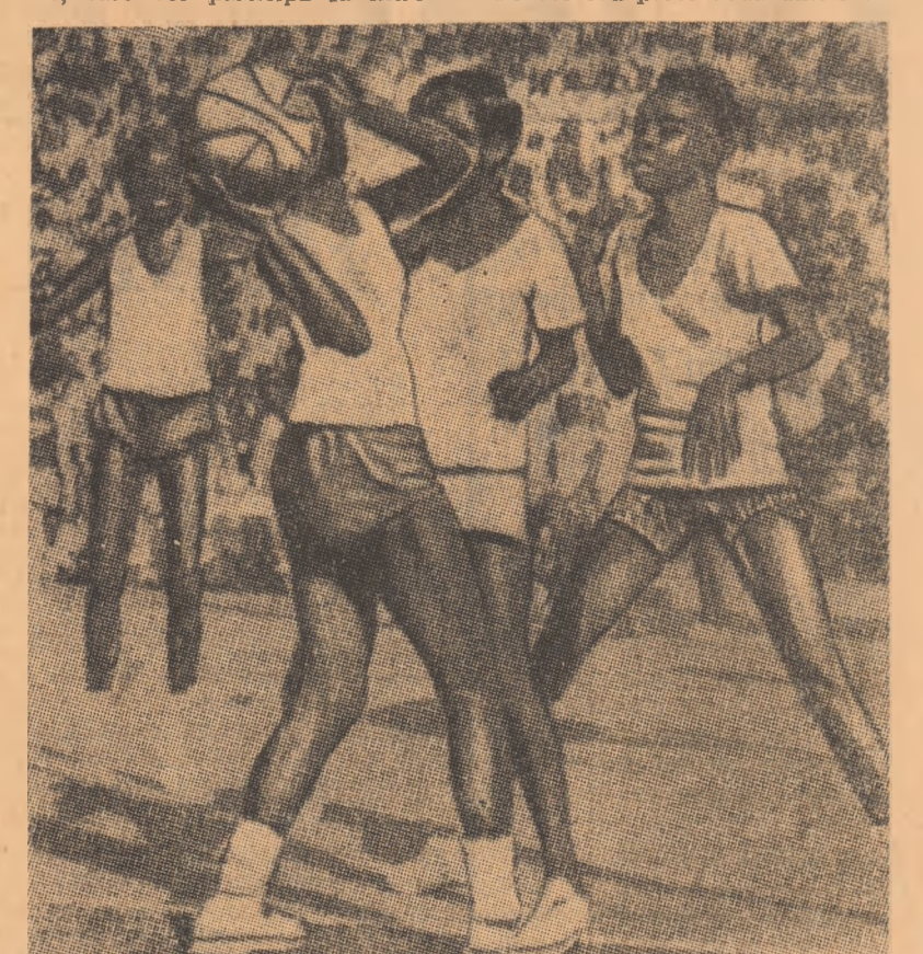
Aceste tinere baschetbaliste din Senegal se pregătesc cu asiduitate pentru selecționarea în echipa feminină a țării, care va participa la a IV-a ediție a campionatului Africii.

pania a început din septembrie anul trecut cu faza de selecție, trecută de 30 de tineri. În prezent, se acordă atenție perfecționării tehnice atât individuale, cit și colective. Din lotul larg vor fi reținute 12 jucă-toare, care vor participa la între-