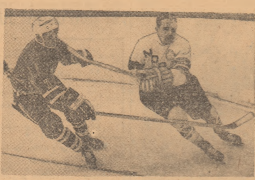
Atacantul norvegian Smefjell l-a depășit pe americanul Grand și a sosit să poartă apărarea de Wetzel. (Faza din meciul S.U.K.A. — Norvegia 3-2 la C.M. din 1970).

Norvegienii sînt de mai multă vreme adversari puternici ai hocheiștilor români, înfîlnirile lor fiind, în cele mai multe cazuri, foarte echilibrate, iar victoriile înăntate. În ultimii ani însă, la Grenoble (1968), la Ljubljana (1969) și București (1970) succesul a fost de partea nordicilor, este drept la diferen-