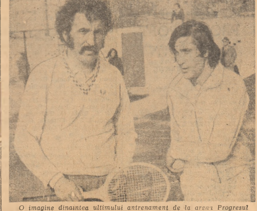
O imagine dinaintea ultimului antrenament de la arena Progresul.

● Tenismenii noștri au plecat la Monte Carlo ● Și în „Cupa Davis” se acordă punctaje pentru Marele Premiu F.I.L.T.