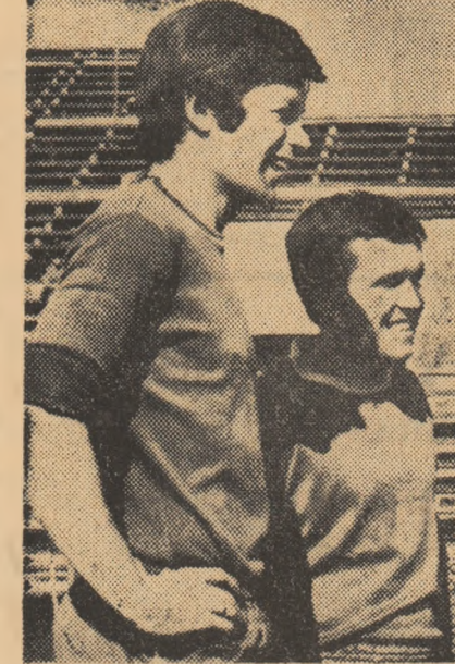
Boc, Codreanu, Angelescu și antrenorul Bazil Marian par optimiști înaintea derbyului de duminică. Imaginea a fost surprinsă ieri în Giulești.