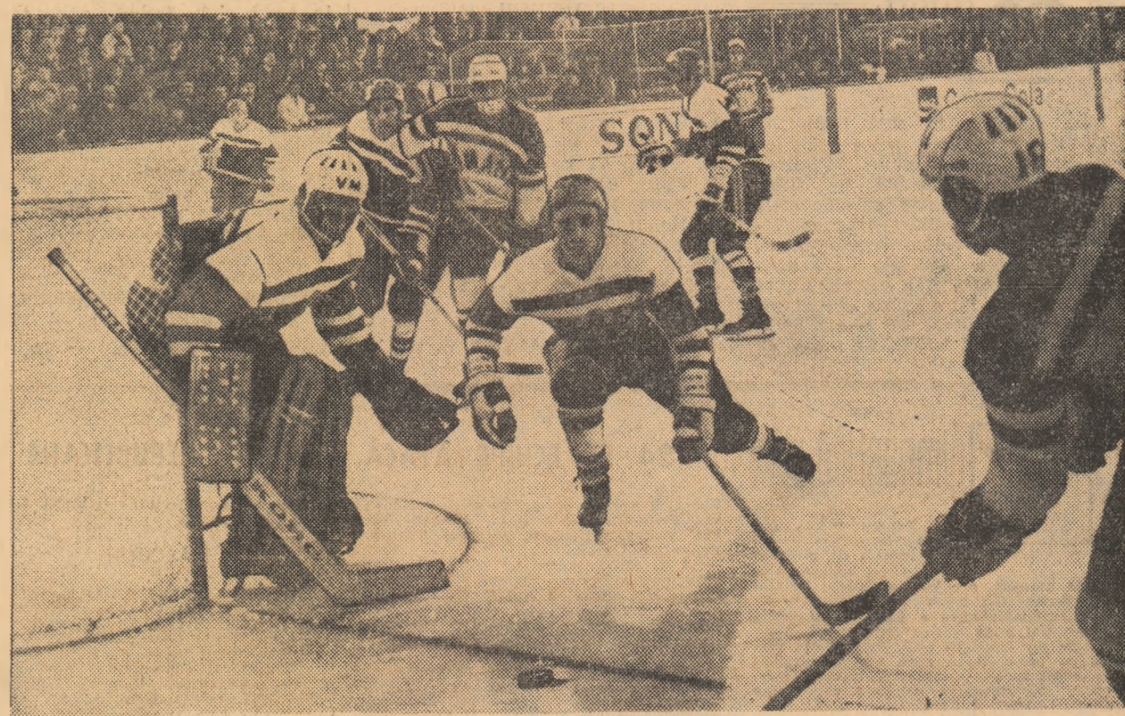
Hufan, cu pucul, nu găsește nici un coechipier demarcat, căruia să-i paseze.