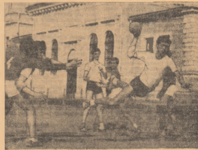
Acolo unde handbalul a devenit una dintre "materile" preferate (Șc. Sp. Năsăud)

mai profunde a tuturor factorilor în problemele vitale ale activității de educație fizică și sport. G. LĂȘAN: Pe acest aspect — al angajării mai profunde și mai responsabile — vreau să insist și eu, subliniind că trebuie să parlamentăm mai puțin și să facem mai mult. Spun asta plecînd de la constatarea că mult din mînturile pe care le stabilim în planurile și planușele pe care le facem la centru sînt foarte puțin aplicate jos sau în unele cazuri, nici nu ajung acolo.