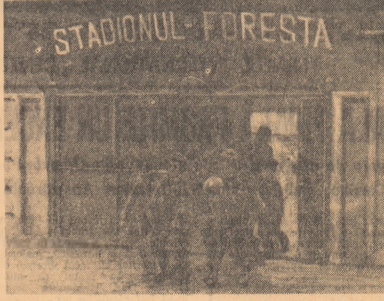
Pe valea Sălăuței, la 5 km de comuna în care s-a născut George Cosbuc, copiii și tinerii din Teicu beneficiază de o bază sportivă cum nu-i alta prin vecini

Un indicator, împlinit la 3 km de Bistrița, pe șoseaua ce duce spre (în trecut) Dorobanți, este un drum semnat de întrebare: "unde? spre unde? Ce istorie țară a Năsăudului sau țării noastre cel care străjuiește, Vaie a Birgăului!"