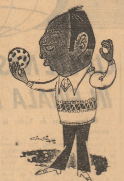
În care urmărim o odihnă eficientă și activă a jucătorilor; în care partidele de verificare nu reprezintă niciodată avangardiere, cum se obișnuia altădată la noi, ci repetiții pentru punerea la punct a armelor care ne interesează. Cred că totul va fi aceluși și când spun asta mă refer la condiția de sănătate a selecționabililor.

— Pregătirea? — După clasicul nostru program.