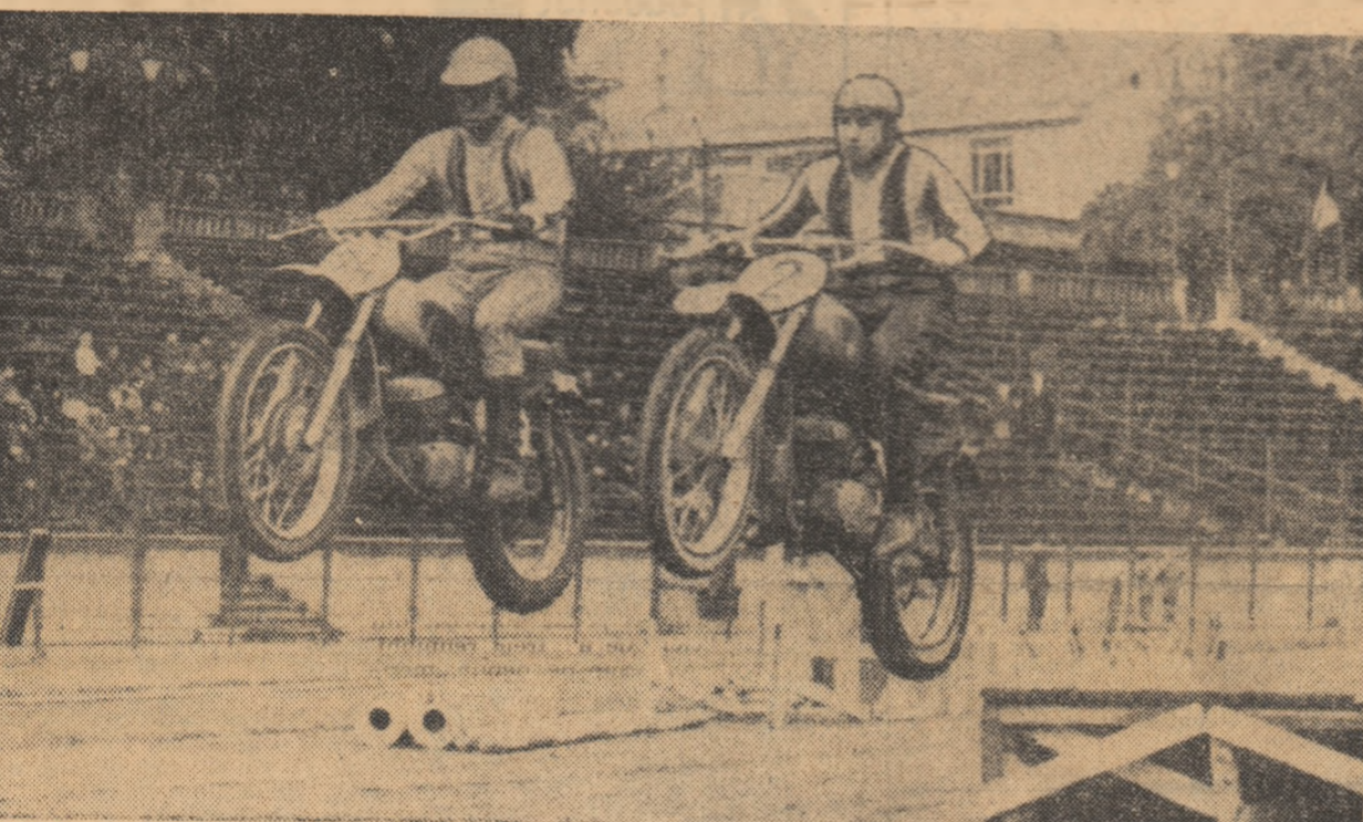
Aspect din timpul demonstrației motociclistilor, în cadrul programului sportiv de la stadionul Dinamo.