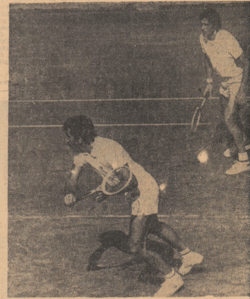
Din nou alături, Ion Țiriac și Ilie Năstase s-au clasat pe primul loc în proba de dublu a turneului de la Roma