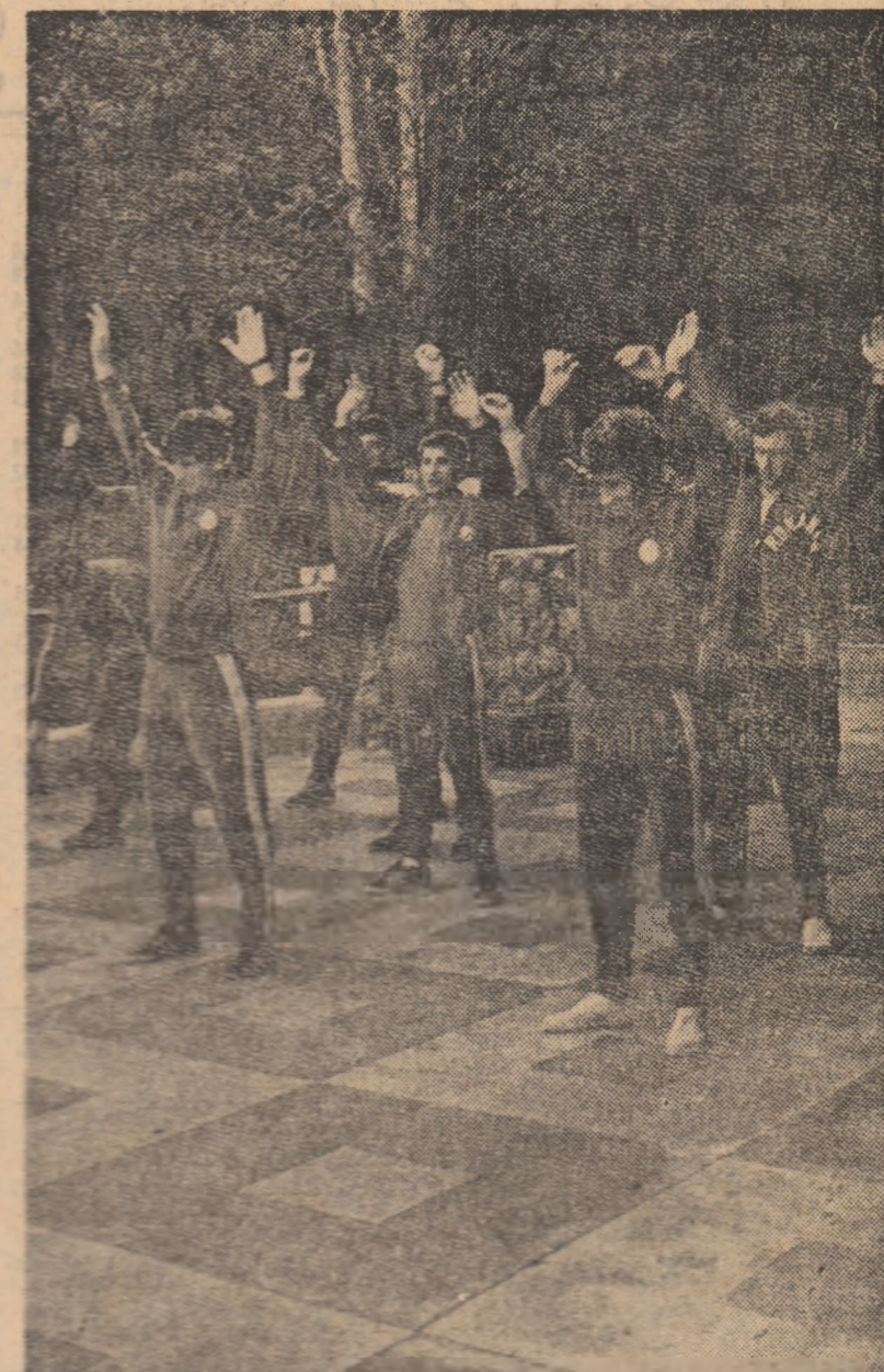
Tricolorii la primul punct al programului: învierea de dimineață.

de prof. Gh. Rîfeld de la Șc. sp. nr. 1 Buc. Tinerii canotori din Capitală au avut o evoluție frumoasă, învingînd detașat. Rezultate: 1. Șc. sp. nr. 1 Buc. (Hipuloi, Kielsch, Popescu, Românic) + Precupeșă) 23:55, 2. Rapid 24:20, 3. Șc. sp. nr. 1 Buc. (II) 24:29.