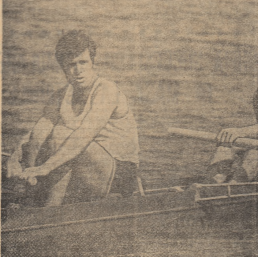
Tudor Ștefan și Petre Ceapura, campioni mondiali la schif 2+1 (Canada 1970), au triumfat — cum era de așteptat — în întrecerea de la Timișoara, unde și-au imbogățit palmaresul cu medaliile de campioni ai țării. Iată-i la cîteva clipe după cursa victorioasă de pe Bega

Azi, începînd de la ora 13,30, se dispută ultima etapă.