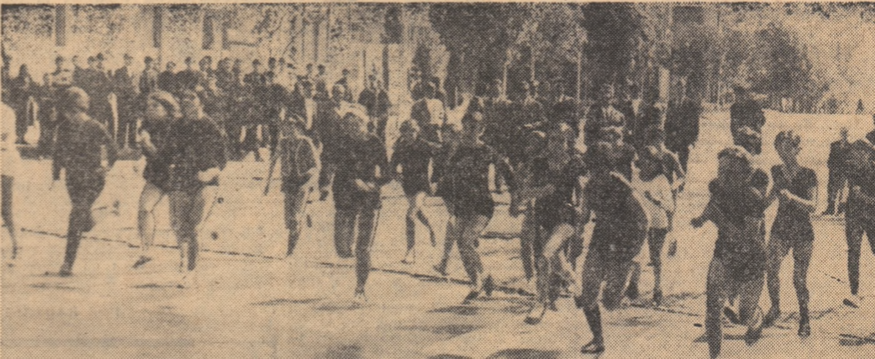
Așa s-a dezvoltat gustul pentru atletism, prin participarea la crosuri școlare de masă. Multe dintre elevii participante la acest cros (organizat în orașul Rimnicu Vilcea) vor deveni, cît de curînd, concurenți la Pentathlonul atletice școlar. Poate chiar la ediția viitoare...