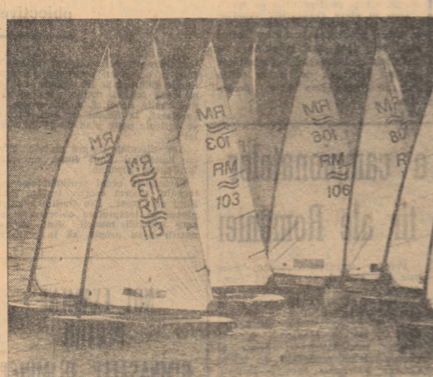
Un buchet de veliere la startul „Capei C.N.U.”

O INTERESANTĂ REGATĂ INTERNAȚIONALĂ Prima confruntare internațională de iahting din actualul sezon s-a consumat de curind la Mamaia, pe scena de apă a lacului Sint-ghiol. Competiția, organizată de Clubul nautic universitar București, a adunat la start sportivi din aproape toate cluburile de iahting din țară, precum și lotul olimpic al Bulgariei. Este de menționat că în cursul celor șase regate vântul a suflat destul de tare, punând probleme dificile velistilor.