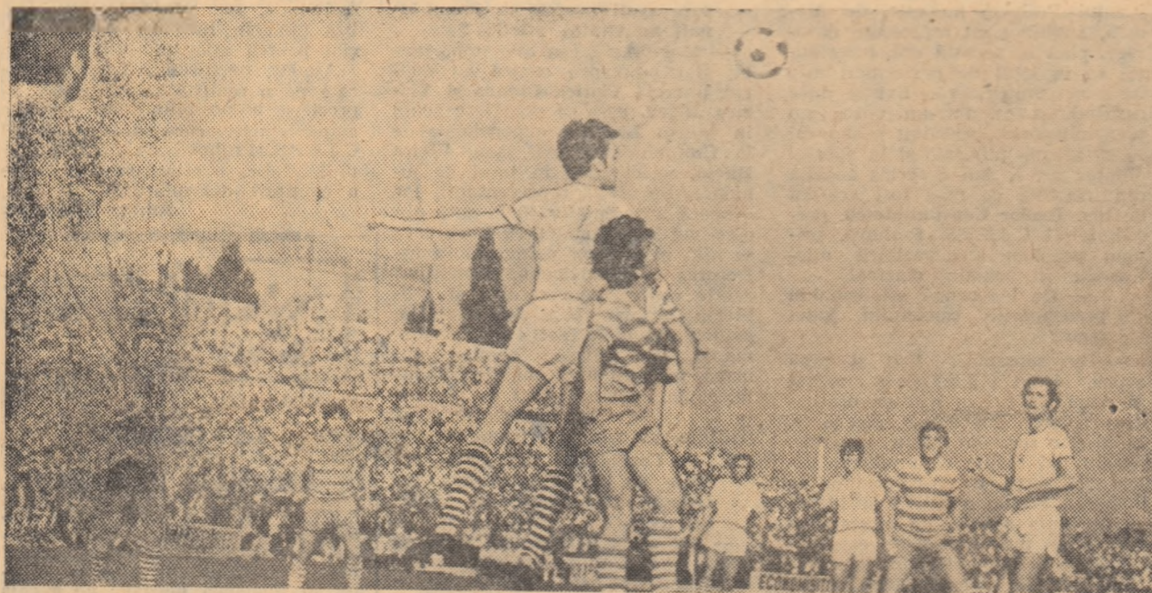
Duel aerian Solomon — Axente, cîștigat de apărătorul clujean care respinge un nou atac la poarta echipei sale