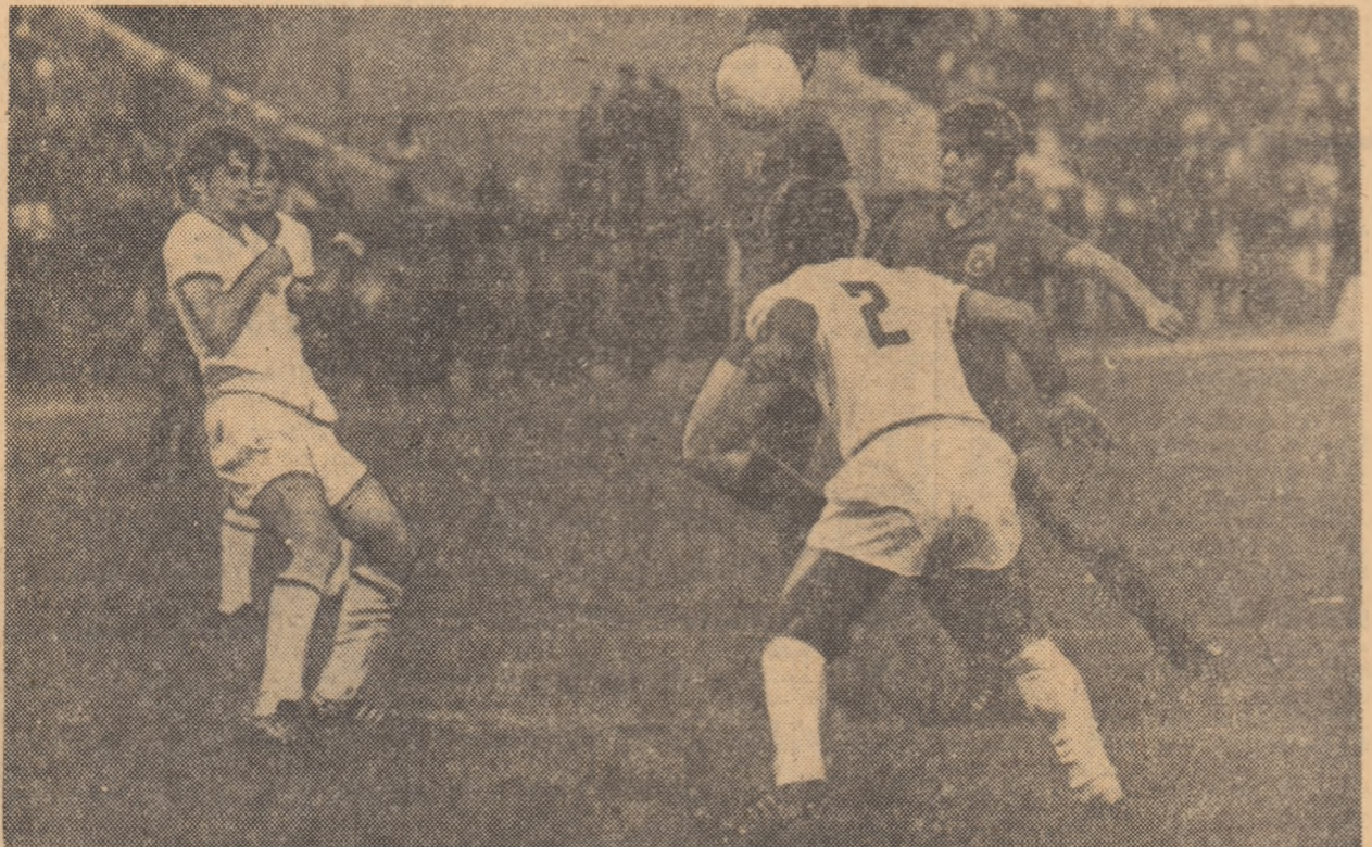
Dumitriu III (mască de balon) și Tătaru, în luptă cu Dinu și Cheran. Un moment al meciului de așară dintre vechile rivale sportive, Steaua și Dinamo.

Îmîlindu-l pe Minoiu, care i-a pus în prim-plan transmisiunile radiofonice, spre final, partidele-cheie de la Ploiești și Iași, deosebit de importante în lupta dramatică pentru evitarea retrograderii, nu vom insista nici noi asupra celorlalte meciuri ale etapei, permițându-ne să acordăm puțin spațiu de care mai dispunem înținerilor de mai sus, soldate cu adevărate lupte de teatru. Realizînd performanța de a învinde la Ploiești și avînd și șansa ca rivala sa directă, Politehnica, să nu obțină decât un punct în jocul cu ultima clasată, C.F.R. Cluj a reușit să-i ajungă pe ieșeni la puncte și la golaveră, avînd acum — cînd a pasat locul 15 echipei moldovene — motive mai puternice să ocrucind să speră că va duce la bun sfîrșit lupta eroică pe care o poartă pentru a-și apăra locul în Divizia A. Și nu știm dacă, pînă la urmă, va fi o luptă în doi sau în... trei, întrucît Petrolul, în mod neașteptat, a ajuns în situația de a înfrunța și ea pe rivala înspumată de la Ploiești clasamentului. (J. Berariu).