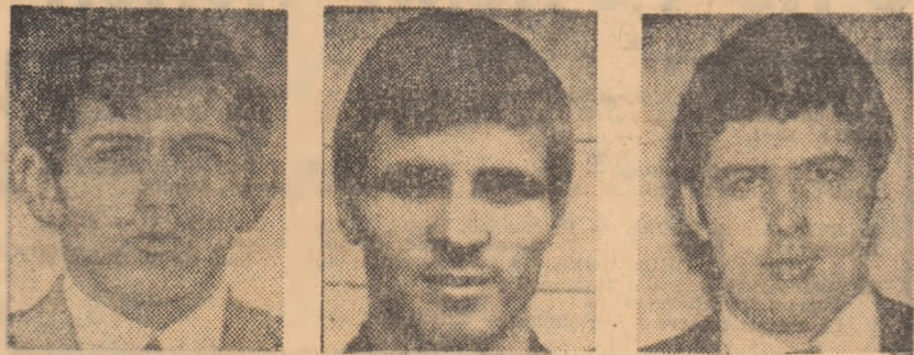
I. GIBU FL. MOT R. CODREANU

comportări remarcabile, cucerind 2 titluri de campioni la greco-romane și 4 la libere. În clasamentul pe națiuni România a ocupat locul II la ambele stiluri, după Bulgaria.