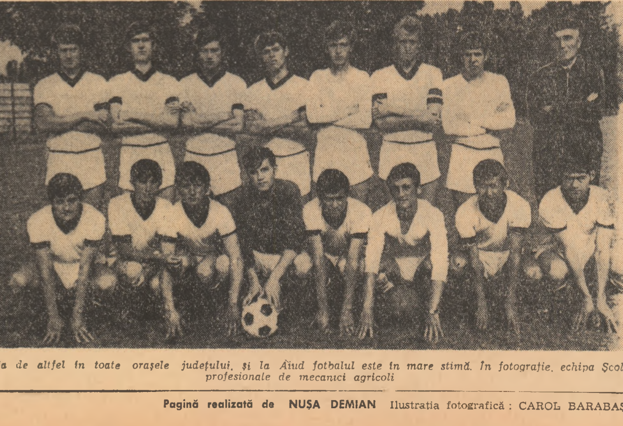
Ca de altfel în toate orașele județului, și la Aiud fotbalul este în mare stimă. În fotografie, echipa Școlii profesionale de mecatruzi agricoli