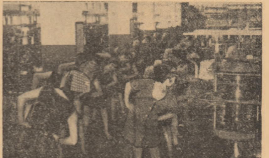
Acolo unde gimnastica la locul de muncă este la ea acasă: Fabrica de ciorapi și tricotaže Sebeș