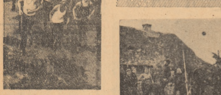
SUS: Întoarcerea de dimineață, crosul, - primul pas pe drumul sportului. DREAPTA: La Ciumburd, atletismul a însemnat întotdeauna atracția pentru sport și apoi performanța