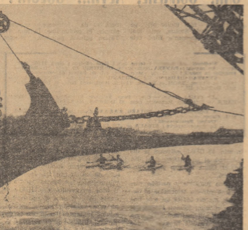
Mascota actualei Jocuri Olimpice este, după cum se știe, un foarte simpatic câțel baset, botezat Waldi.