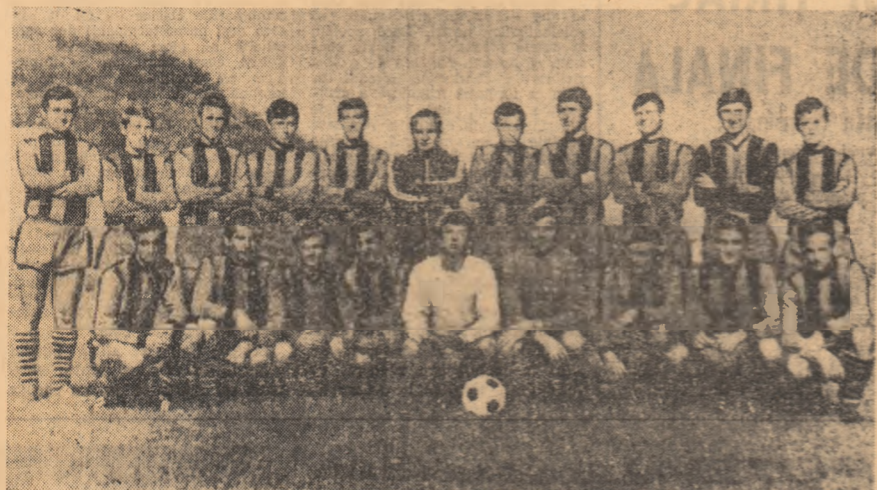
adversar, acasă sau în deplasare. — De ce lot ați dipus în acest campionat?