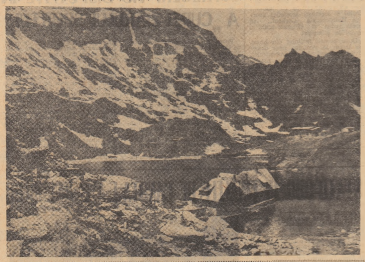
O zonă de vis a muntilor Făgăraș. Situață pe versantul nordic al munților - la 2000 m altitudine - pe o peninsulă a lacului de pe terasă superioară a căldării glaciare a Văii Bilec, Cabana Bilec Lac se bucură de faima celei mai frumoase așezate baze turistice din țara noastră. Loc de poșas apreciat de drumeții ce parcurg această principală creastă a „Alpilor Transilvaniei”.