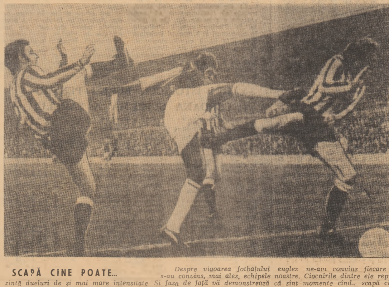
SCAPĂ CINE POATE... Despre vigoarea fotbalului englez ne-am convins fiecare și s-au convins, mai ales, echipele noastre. Cîntirile dintre ele reprezintă dueli de și mai mare intensitate. Și așa de față vă demonstrează că sînt momente cînd... scapă cine poate din atacurile foarte decise și... nu întotdeauna regulamentare

Scrisoarea cercului olimpic al elevilor de liceul „N. Bălcescu” din București