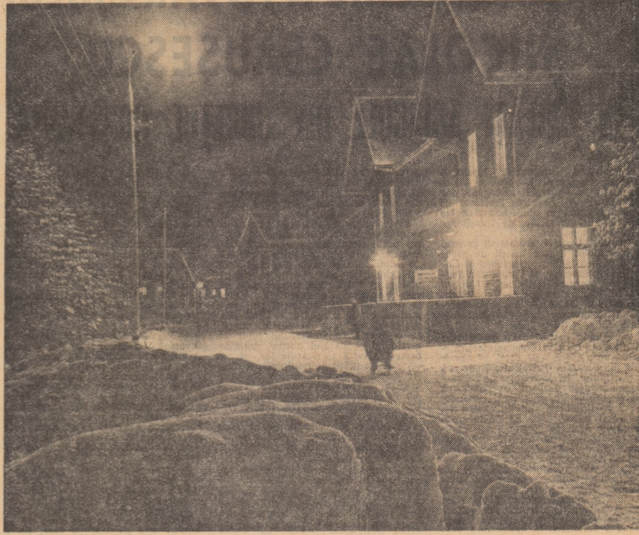
Perla Sibiului - Păltînișul - strălucind în noaptea. Pentru cei care nu cunosc omănuțe referitoare la acest minunat loc de recreere, iată cîteva: Păltînișul este cea mai înaltă stațiune climaterică din țara noastră (1450 m). Este corana Sibiului așezată pe fruntea munților Cîndrelului numiți și ai Cîbinului (2245 m).

43 din cele 55 de comune din județ au răspuns chemării la întrecerea lansată de comuna Pechea - județul Galați, propunîndu-și amenajarea și reamenajarea a 102 obiective sportive. În conformitate cu prevederile Legii 20/1971 asupra contribuției cetățenești, orașele Sibiu, Medias, Agnita, Ocna Sibiului, Dumbrăveni, Șeica Mică, Sîlnic și Săliște au alocat peste patru milioane lei pentru amenajarea unor baze sportive. 7 orașe ale județului Sibiu (Sibiu, Medias, Agnita, Cîsnădie, Copșa Mică, Dumbrăveni și Ocna Sibiului), răspunzînd chemării lansate de Consiliul popular județean Hunedoara au alocat un total de 4 milioane lei pentru amenajarea unor terenuri de joacă și terenuri simple în cartierelor de locuințe. Membrii U.T.C. din Sibiu, după ce au realizat prin muncă patriotică patinoar artificial al orașului (1 mai 1972) și-au propus să realizeze și o bază sportivă a tineretului în Valea Aurie (Parcul Sub Arini) compusă din bazine înol, terenuri de volei, baschet, tenis, handbal, fotbal, atletism și pistă de curluri. În 1972 se organizează de către C.J.E.F.S. Sibiu