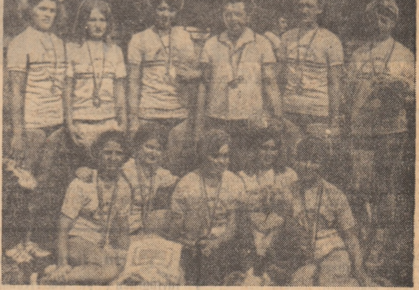
Fericeite - după încă un succes - fetele din Miercurea zîmbesc obiectivului fotografic

...Nu am povestit cu o anume intenție cele de mai sus, dar dacă stau să mă gîndesc bine, le-aș putea da ca exemplu. Nu credeți?