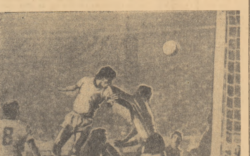
Jairzinho înscrie cu capul golul victoriei. Brazilia — Portugalia 1-0, în finala Cupei Independenței