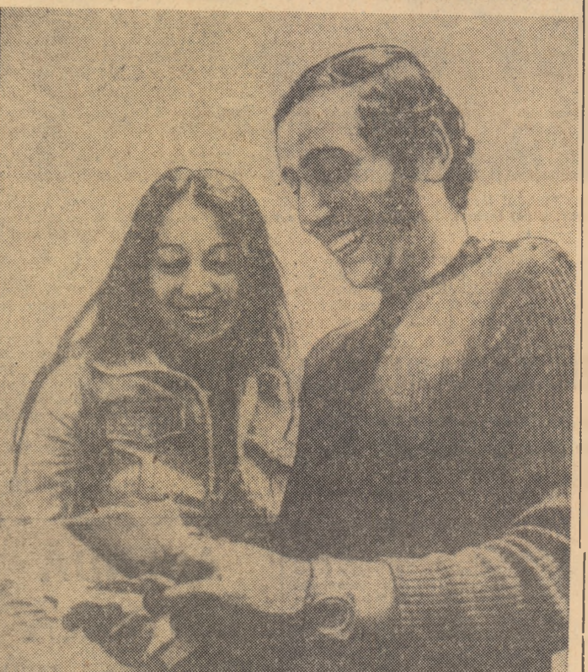
„TRANSA“ cursa de traversare a Atlanticului pentru navigatorii solitari, s-a încheiat vineri seara cu victoria neașteptată a francezului Alain Colas (29 de ani). Sărbătorit este 2810 mile între Plymouth (Anglia) și Newport, oțlat pe coasta de est a Statelor Unite, în 20 de zile, 12 ore și 20 de minute, la bordul trimaranului (vas cu trei cocci) său „Pen Duick IV“, Alain Colas a stabilit și un nou record al întrecerii.

Comitetul Olimpic Francez a anunțat că la Jocurile Olimpice de la München vor participa 297 de sportivi francezi (253 de bărbați și 42 de femei), însoțiți de 88 de ofițeri. Cele mai numeroase delegații vor fi cele ale atletilor — 64 (46 atleți, 18 atlete) și înnotătorilor — 34 (16 bărbați, 18 femei).