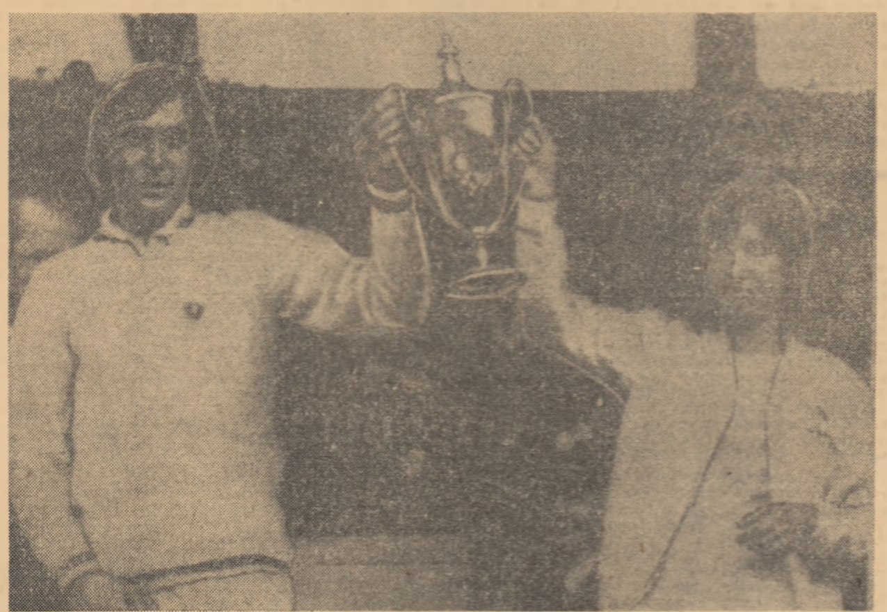
Ilie Năstase și Rosemary Casals, cu prețiosul trofeu