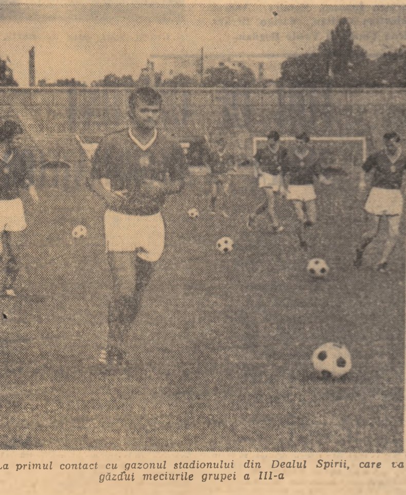
La primul contact cu gazonul stadionului din Dealul Spirii, care va găzdui meciurile grupei a III-a

Astăzi, 19 iulie, în jurul orei 9,00, posturile noastre de radio și televiziune vor transmite direct de la Sala Palatului Republicii deschiderea lucrărilor Conferinței Naționale a P.C.R., raportul prezentat de secretarul general al partidului, tovarășul NICOLAE CEAUȘESCU.