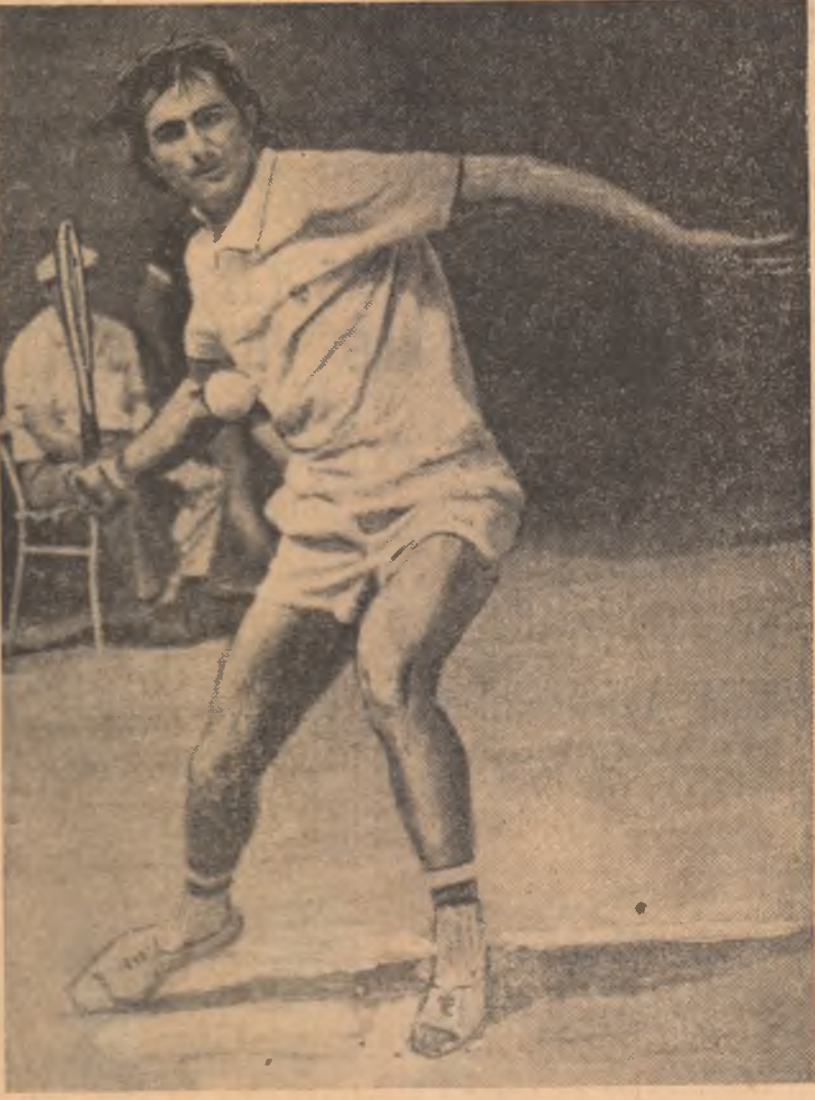
Ilie Năstase luptă irezistibil pentru victorie

TBILISI, 23 (prin telefon de la Tbilisi, 23)