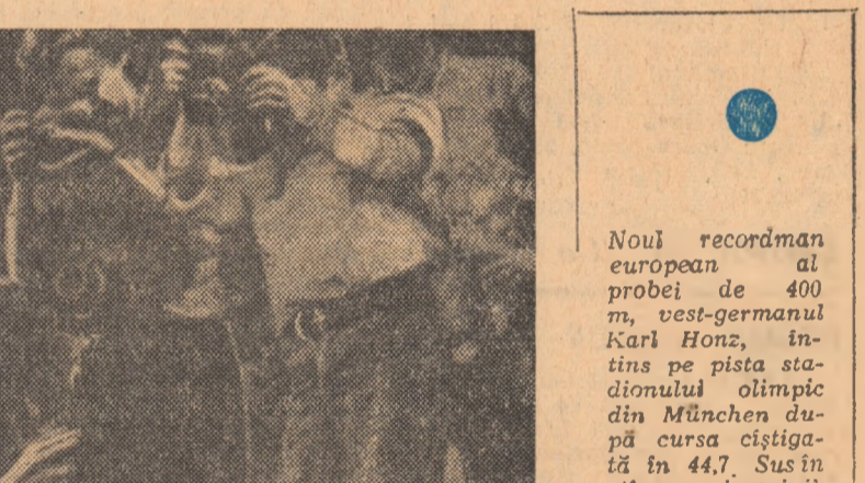
Noul recordman european al probei de 400 m...