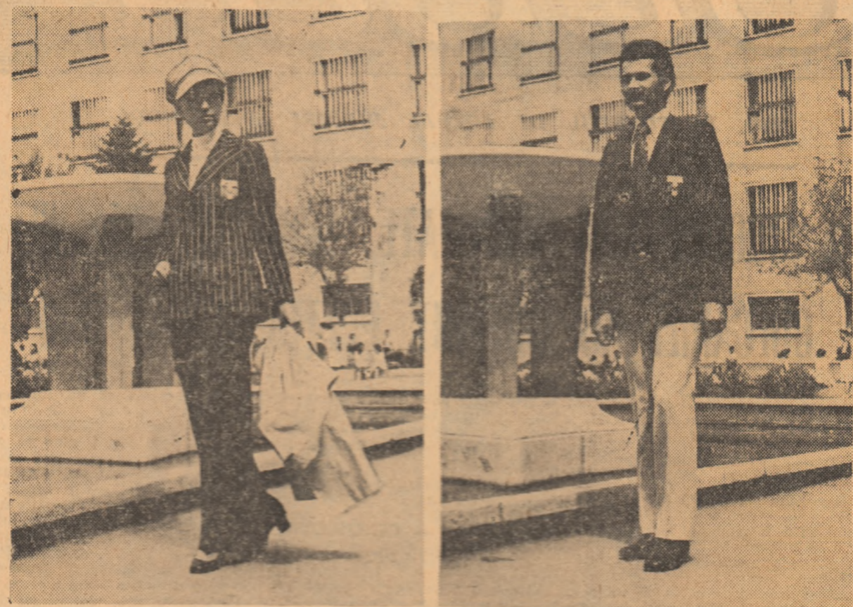
Tinuta sportivilor români nu este simțămînd indiferență. E vorba nu numai de un respect formal pentru etichetă, ci și de corectitudinea vestimentară și de impresia generală pe care reprezentanții noștri în marile competiții internaționale o fac asupra spectatorilor.