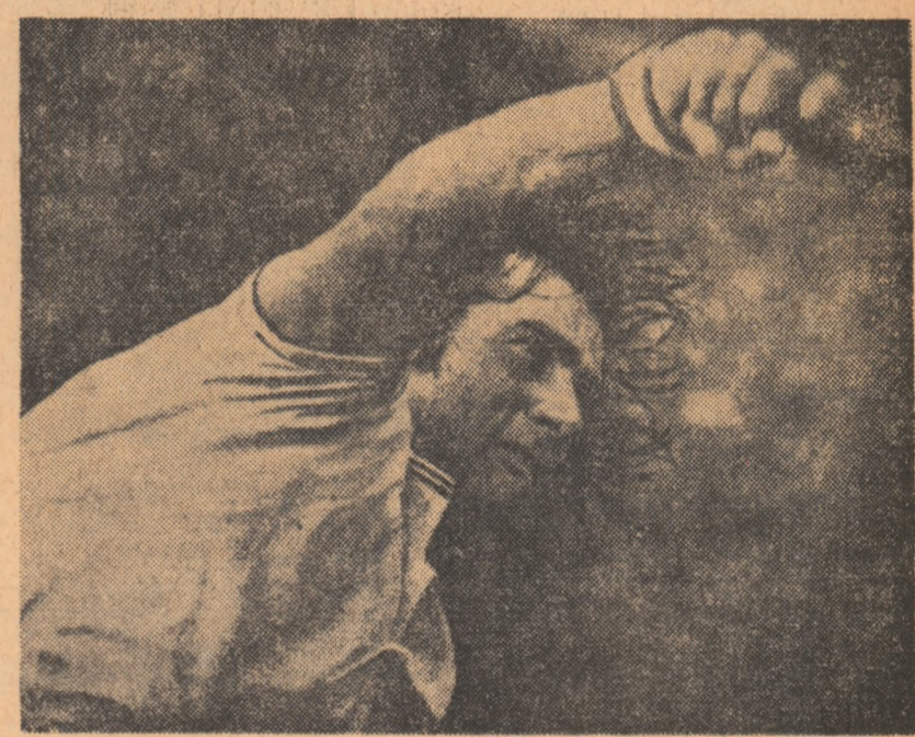
Un prim-plan caracteristic al lui Ilie Năstase, în timpul finalei de la Düsseldorf.