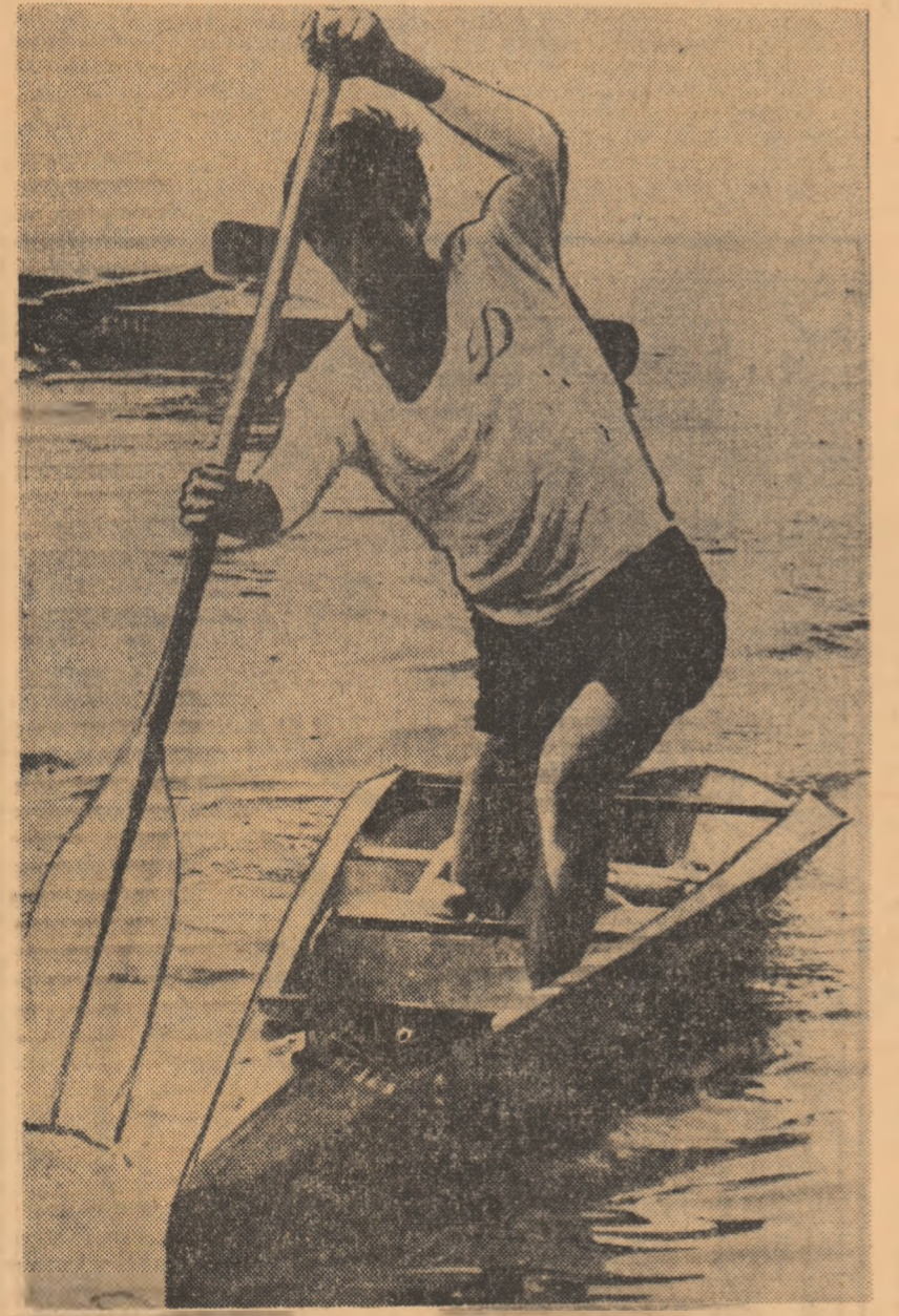
Reputatul canoist I. Patzaichin a obținut o prețioasă victorie și pe lacul Bagsvaerd.