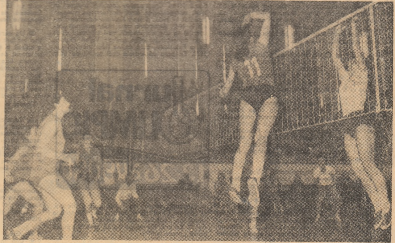
Volei - sport îndrăgît în județ - pe podiumul Sălii sporturilor din Constanța

bilaterale cu sportivii din Bulgaria, Cehoslovacia, Iugoslavia și Polonia (la popice, schi nautic, inot) ș.a.m.d. În final o cifră edificatoare: în 1971 - pe parcursul a trei luni, adică al sezonului estival - în județ s-au organizat 86 întîlniri internaționale la 18 ramuri de sport. Și so pare că, după date preliminare, în 1972 cifrele vor fi mai mari!