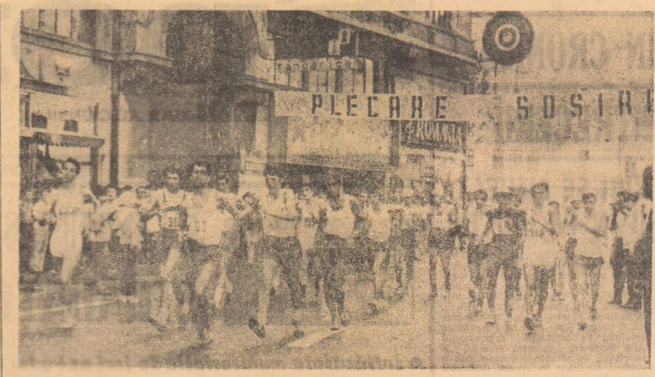
Start în cursa seniorilor