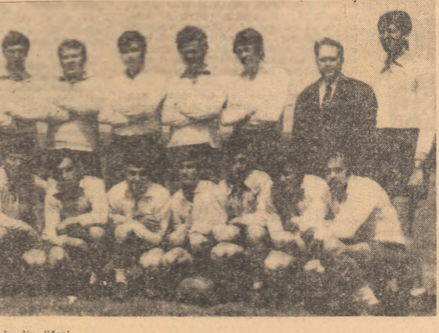
15-le din Săcele