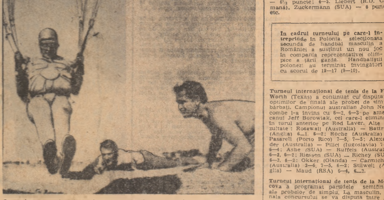
O aterizare excelentă - chiar în punctul care marchează centrul cercului - a sportivului sovietic Nikolai Umhaev...