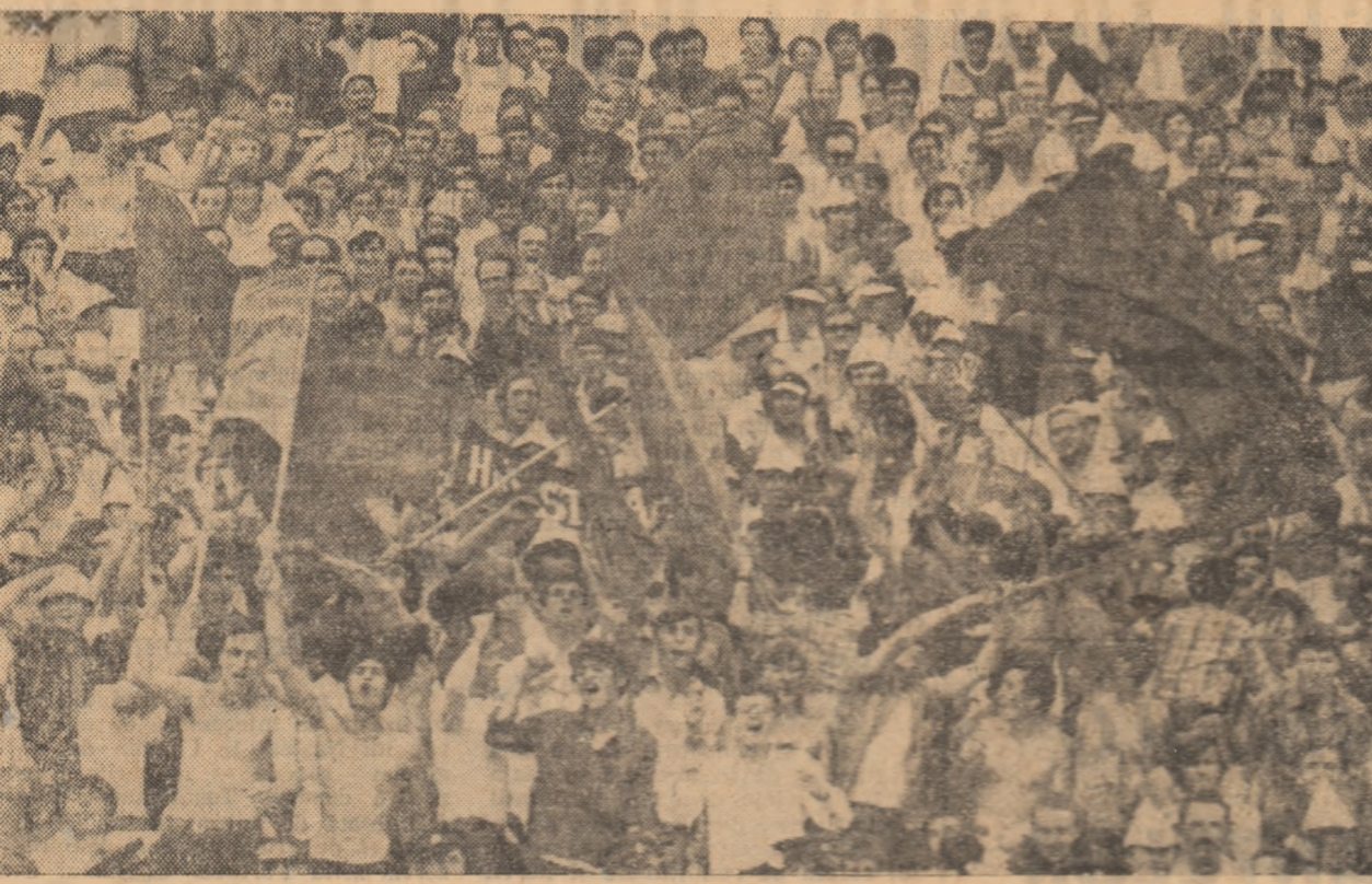
Entuziasmul tribunelor în ziua unui meci internațional al unei echipe românești atinge, cele ridicate...