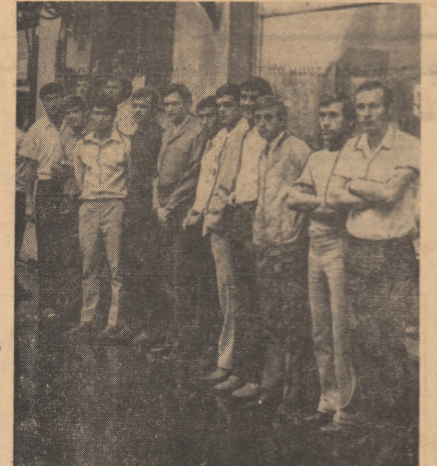
Întâlnirea fotbalistilor băcăuani, oaspeții Capitalei în prima etapă, adăpostindu-se de ploaia care a căzut ieri în vecinătatea hotelului Muntenea.

În sfârșit, încep. După 35 de zile de vacanță, agenda fotbalului a intrat de azi în obștinatele drepturi în programul nostru, în viza penultimă de luni a zilei. Pentru penultima etapă a fotbalului românesc, ziua de azi este și a campionatului, se prezintă cu obștinutul cortegiu de speranță și proiecte ale fotbalistilor, antrenorilor și spectatorilor. Un campionat care să producă „Cu excepție partidele Steaua — ASA și Farul — C.F.R. Cluj, restul meciurilor încep la ora 17. Speranțe și proiecte de început de drum. Poate că, totuși, azi (și nu poate, ci sigur), deservit față de alții azi apare — la toate categoriile citate ale fotbalului nostru — UN GIND NOU, un gând învârtit din evoluția din ultima vreme a fotbalului românesc. Pe multe planuri — fotbalul românesc a făcut siguroși pași înainte, afirmându-se, impunând respect și stimă. Performanțele, cu ecouri diverse, au avut și au ecou și în conștiința lumii noastre fotbalistice. Am început să fim cineați în lumea