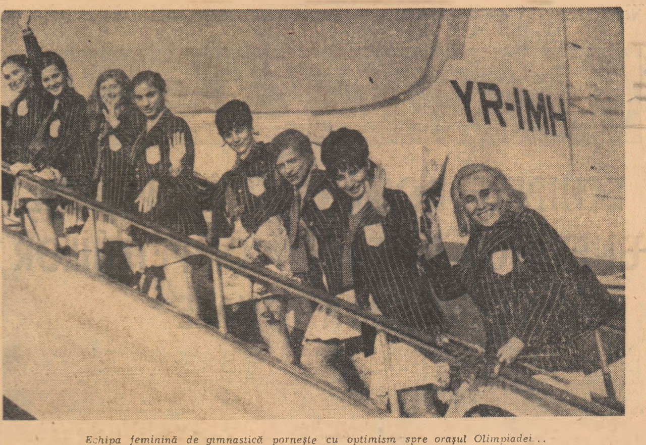
Echipa feminină de gimnastică pornește cu optimism spre orașul Olimpiadei...

ora 22.30 Gimnastică individuală bărbai — exerciții liber așez, cîlimm — urmărire individuală, judo — categoria 83 kg (transmisii directe).